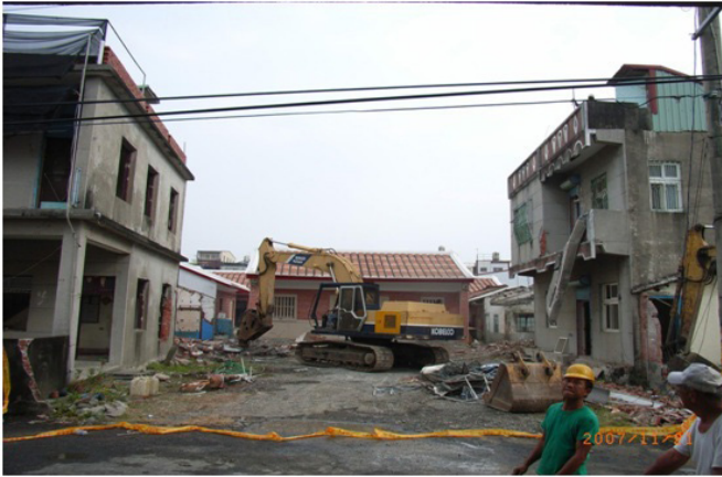
圖 8 楊家祖堂重建前樣貌之 2