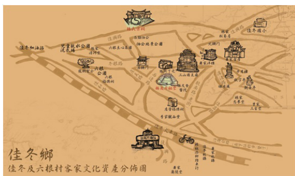
圖 1 佳冬鄉佳冬村及六根村客家文化資產分佈圖