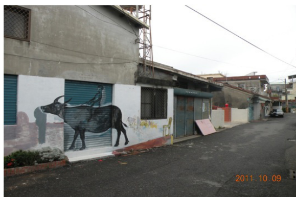
圖 19 佳冬六堆詩人漫步路徑景觀之 2