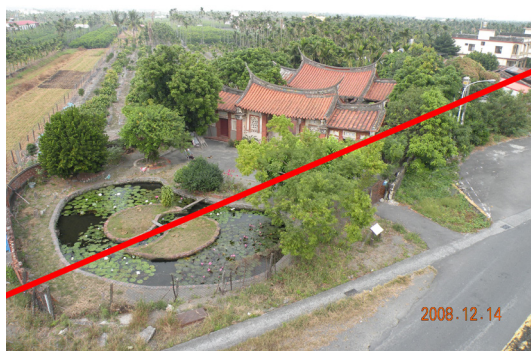
圖 2 楊氏宗祠全貌 5

重新建構下六根庄客家文化的火種，激活了下六根庄平日感受不強的文化地圖（曾貴海 2011：159；楊雲岫嘗管理委員會 2011：7）。在楊氏宗祠之後，楊及芹祖堂的重建、張家商樓募款整建，及六堆詩人漫步創作路徑等又陸續完成（圖 3）。