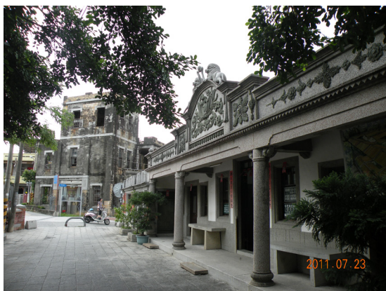
圖 13 佳冬蕭屋及蕭家洋樓

第五堂為一般住家（圖 14）。特別值得一提的是步月樓，以前是蕭家的書房兼藏書小閣，也是文人雅士聚集棋琴書畫的地方。在清廷割讓臺灣後，日本人於光緒 21 年（1895）10 月 21 日由枋寮及佳冬海岸登陸，曾發生六堆史上著名的步月樓戰役，至今仍可在步月樓牆壁還留有許多彈孔，訴說著六堆先民抗日的英勇精神（圖 15）。