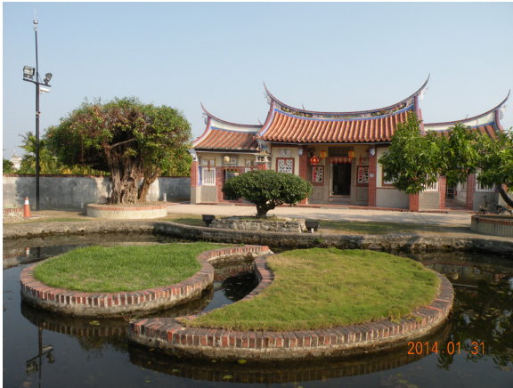
圖 6 楊氏宗祠整修完工後景觀