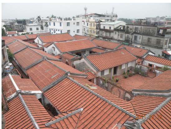
圖 14 佳冬蕭屋五進落大厝景觀