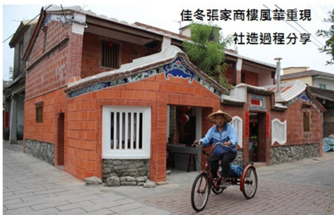
圖 12 張家商樓（張阿丁宅）整修後全貌