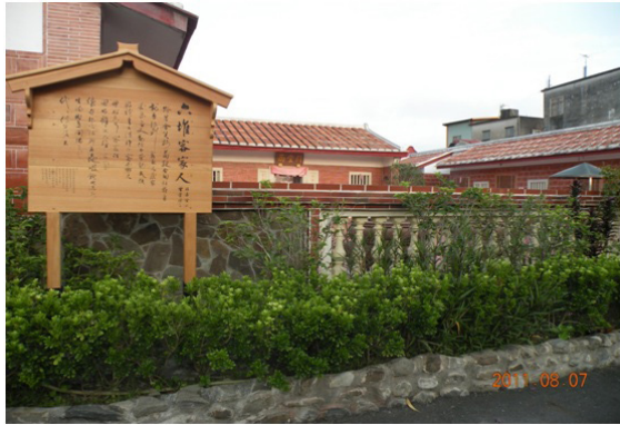
圖 20 佳冬六堆詩人漫步路徑景觀之 3（楊家祖堂）