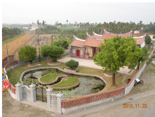
圖 3 楊氏宗祠經搶救保存運動成功獲公告為古蹟，整修後全景