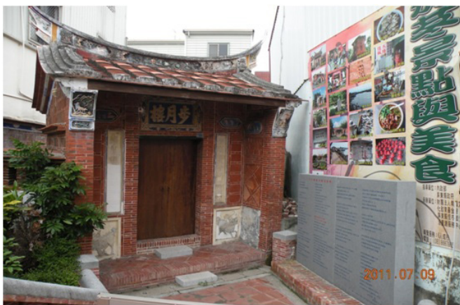
圖 15 佳冬蕭家步月樓景觀