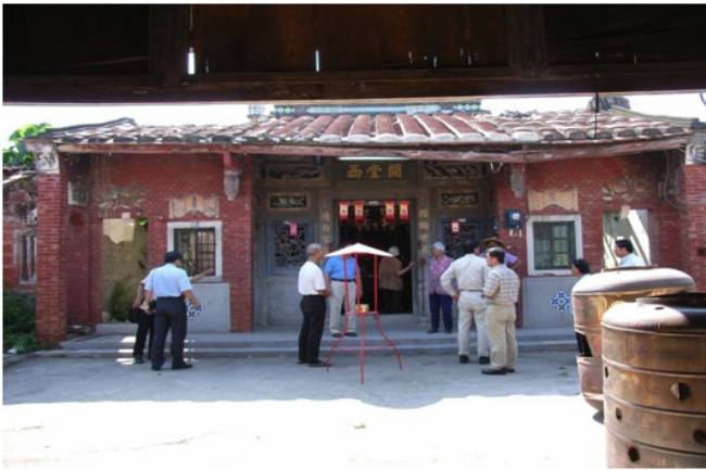
圖 7 楊家祖堂重建前樣貌之 1

重建祖堂最為特殊的是，因原有建物都已損毀，必須以現代建材來建造，但儘可能依原式樣重建，而為了能讓子孫感念前人，特別將原先祖堂的「透空花窗」和「垂花吊筒」鑲在新的祖堂裡，非常具有傳承的意味。重建祖堂讓楊家子孫展現了團結合作、互相扶持的精神，重新打造這個屬於楊家，屬於臺灣珍貴的文化資產。重建的不只是建築體，更珍貴的是無形的凝聚力與歸屬感。《祖堂重建的推手》紀錄短片，說明了管理人克服困難的細節，以及族人的爭議與共識的建構過程，呈現出推動整合的艱辛、毅力及家族通力合作的種種場景，可作為未來他處重建祖堂或家族公共場所的典範。