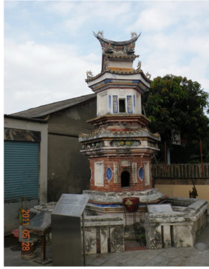
圖 17 佳冬敬字亭景觀