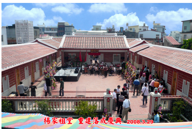
圖 10 楊家祖堂重建後樣貌之 2