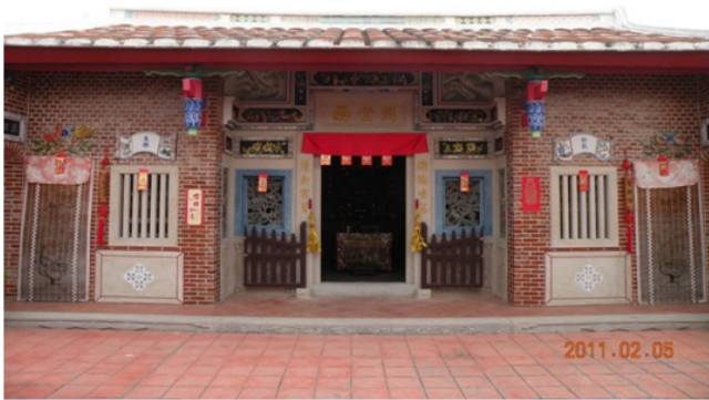
圖 9 楊家祖堂重建後樣貌之 1