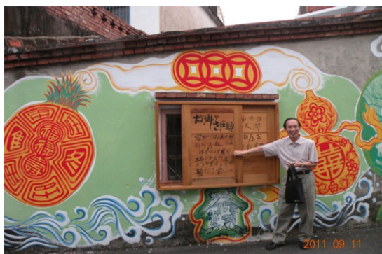
圖 18 佳冬六堆詩人漫步路徑景觀之 1