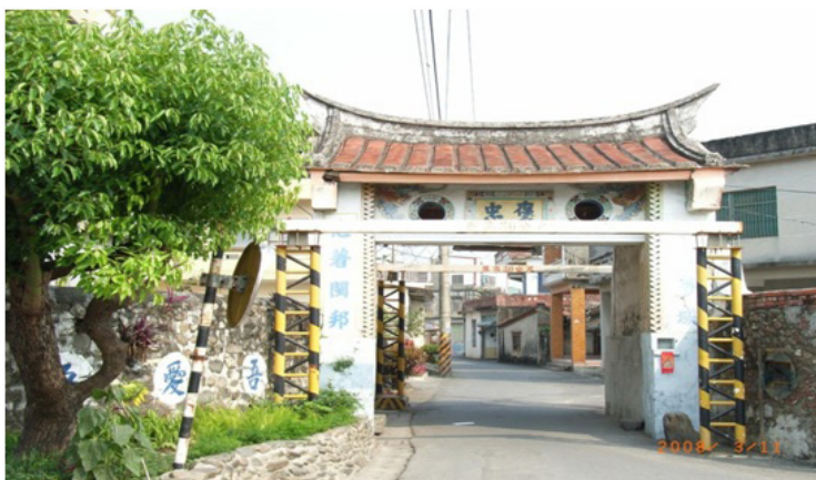
圖 16 佳冬西柵門景觀