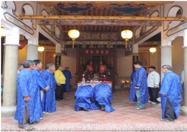
圖 5 楊氏宗祠每年清明前一日舉行祭祖典禮