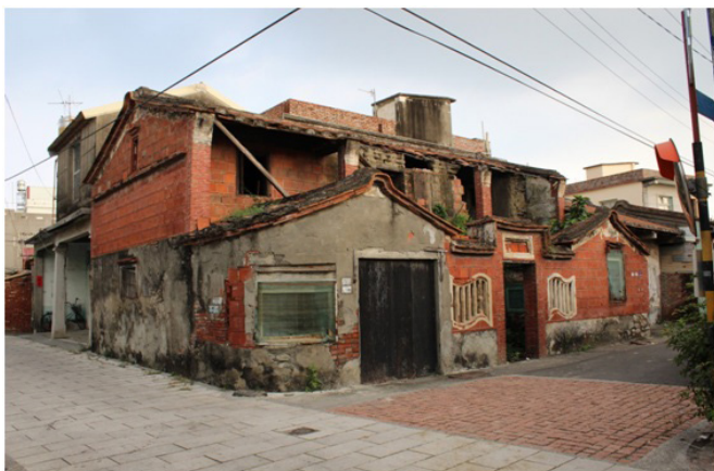
圖 11 張家商樓（張阿丁宅）整修前舊觀