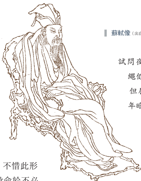
蘇軾像（出自晚笑堂畫傳，1743年）。