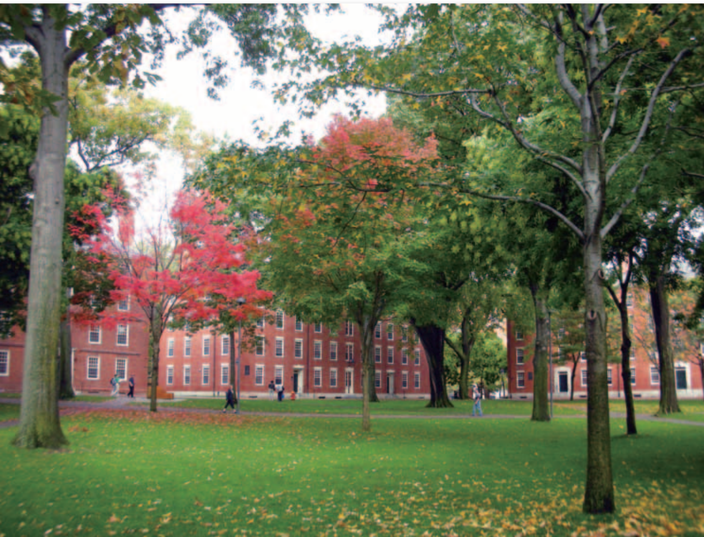
哈佛校園。

概他們以為國外注重通識教育的緣故吧。但這是捨本逐末的事情。坦白說，我還沒有看到過一個有水準的國家和城市不反反覆覆的去教導國民本國或本地的歷史的。我兩個孩子在美國一個小鎮讀書。他們在小學、在中學，將美國三百年的事情唸得滾瓜爛熟！因為這是美國文化的基礎。