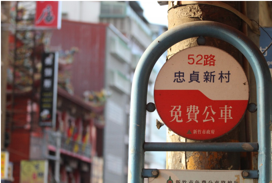
公車站牌證明忠貞新村的 存在 。