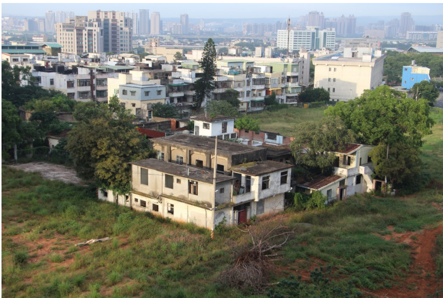
忠貞新村原址之中保存較為完好的建築物。