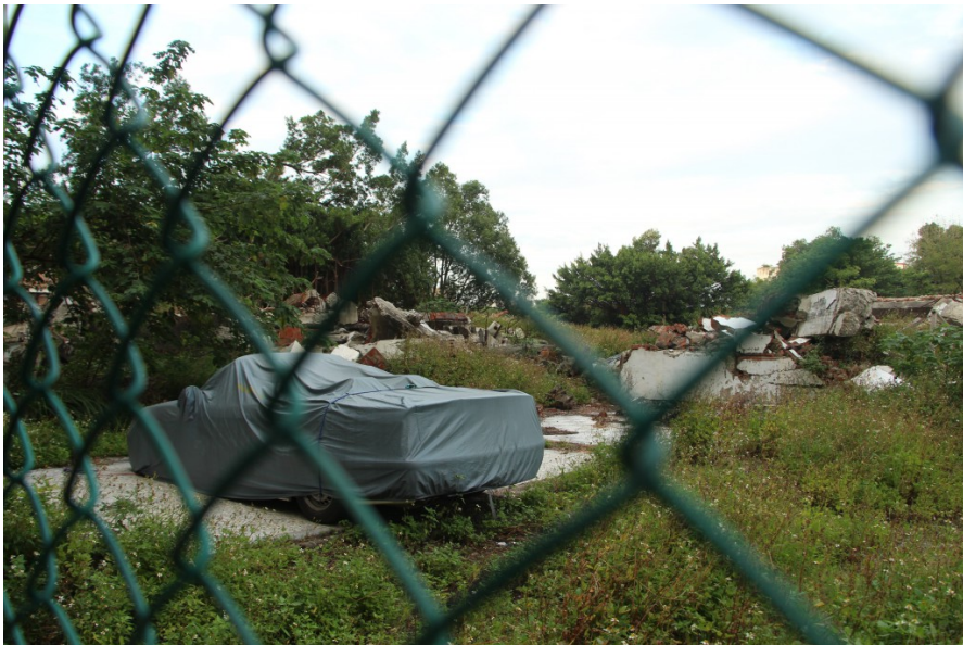
2015年四月，相鄰的北赤土崎新村，日本海軍燃料遺留廠房（俗稱寡婦樓）被原住戶自行拆除。