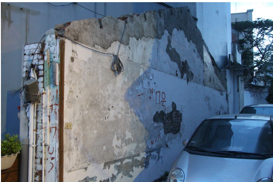
儘管寫著拒拆紅字，建築物仍被拆除。