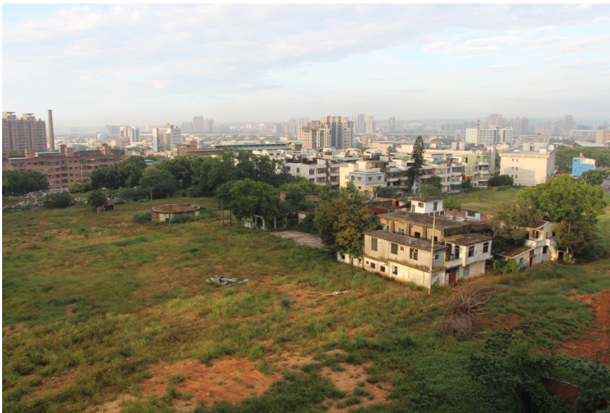
忠貞新村拆遷後，原址只留下一大片紅土與雜草。

在文史工作者的呼籲之下，政府暫停拆除眷舍，計畫將遺留下來的空間與附近的眷村結合起來，規劃眷村文化園區。