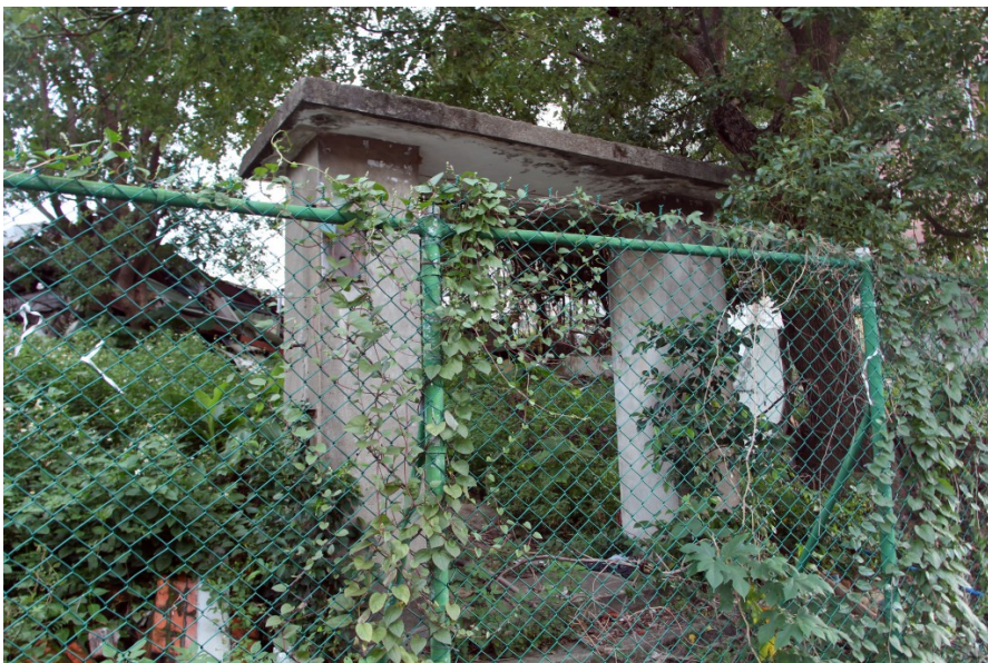
廠房被拆除後只剩下門柱。