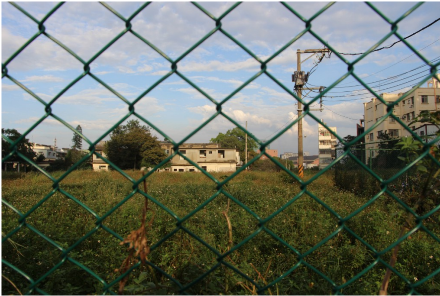
眷村原址被綠色塑膠網圍住，與外界隔離。