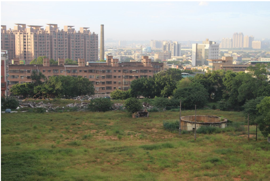
海軍燃料廠的大煙囪與眷村中的圓筒形儲油槽基座是軍事工業遺跡。