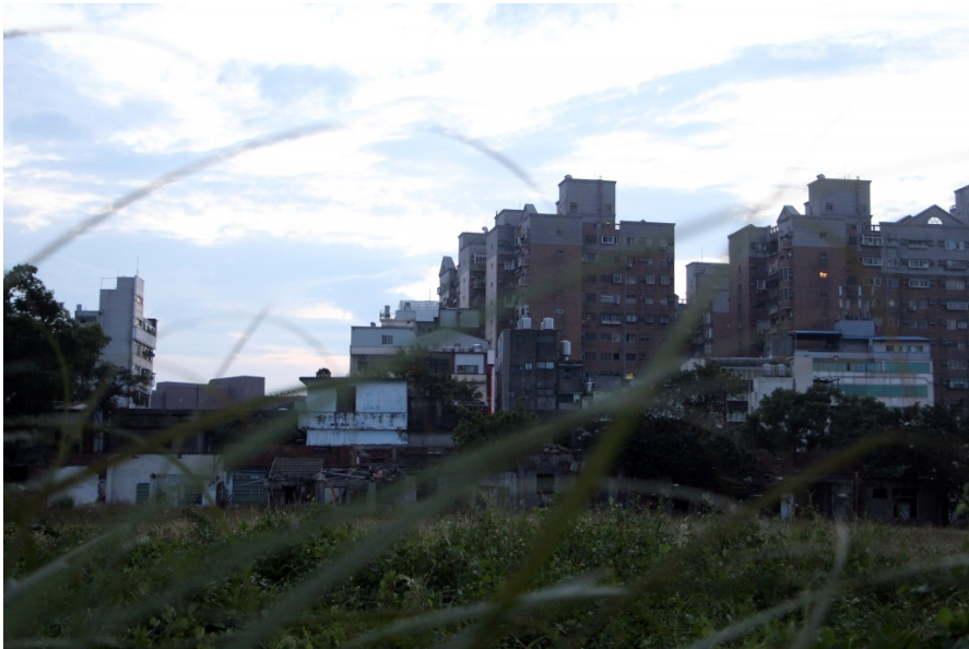
破舊的眷舍與後方高樓形成對比。