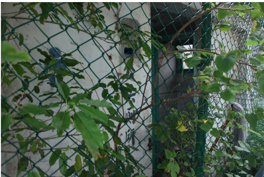
早期眷村屋舍沒有廁所，村民使用的公共廁所如今被植物掩蓋。