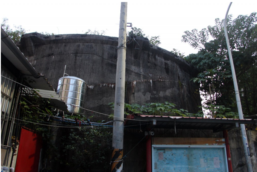
從一牆之隔的仁德國宅社區看另一座儲油槽。