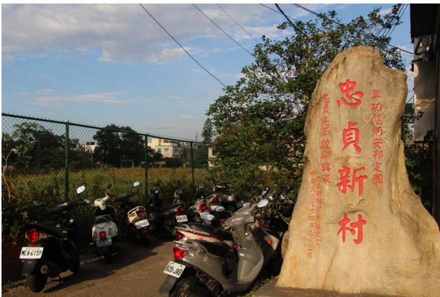
眷村入口處只剩下民國94年立的紀念石碑，通往村子的道路已經封住，停滿機車。