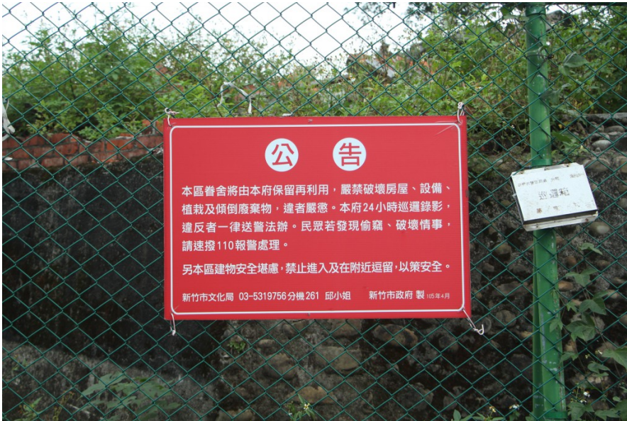
同年四月，新竹市文化局發公告禁止破壞眷村。