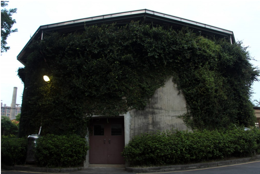
位於建功國小的儲油槽被校方再利用，成為藝文展示空間。