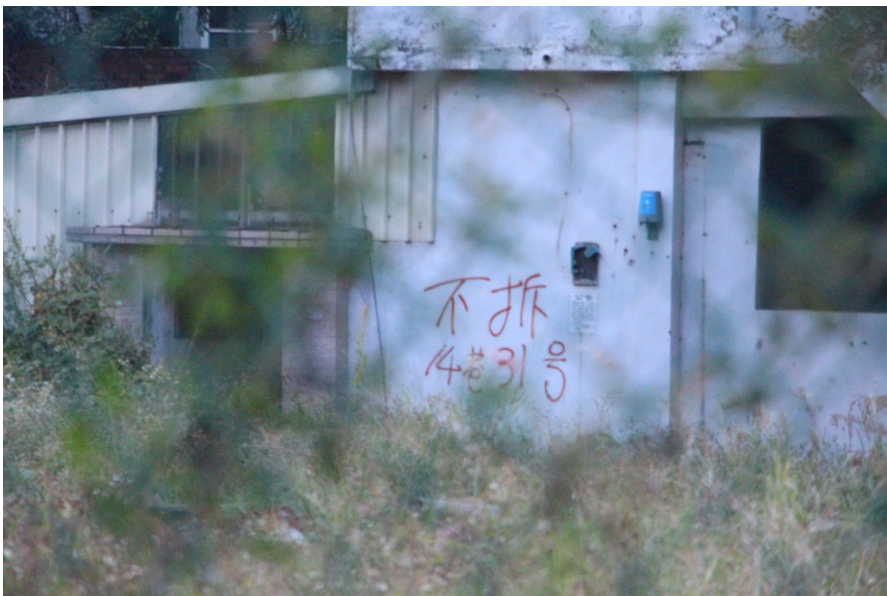
牆上的紅字表達住戶不願房子被拆除。