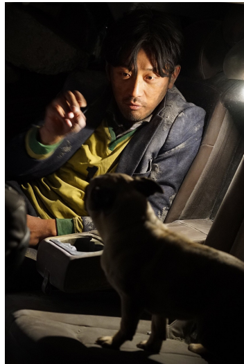
李正秀和天吉分享狗糧，苦中作樂。