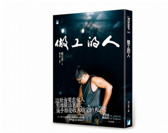
單刀直入的書名，正也反映工人的率直真誠。

書一攤開，「工地人間」四個大字赫然映入眼簾，接著可以看到工地裡的人物一一現身：先是「八嘎囧」年輕陣頭少年，講他們從小工做到師傅，如何撐起整個工地、宮廟、甚至地方的文化社群；「工地大嫂」講師傅的妻子「喊水會結凍、喊米變肉粽」的能力，靠一支電話指揮調度工程，是工地裡不可或缺的存在；「工地外勞」講外籍移工在台灣的生存困境，逃去工地工作是因為「比較自由」。