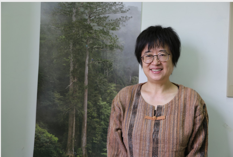
呂植致力於尋找人與野生動物共存的平衡點。

呂植為中國非政府組織（Non-governmental organization，縮寫NGO）「山水自然保護中心」創辦人、北京大學生命科學院教授。早期以研究熊貓聞名，被《紐約時報》譽為「未來中國值得關注的六位青年人物」之一。而今不只是保育熊貓，呂植更將視野拓展到其他物種，致力於尋找人與野生動物共存的平衡點。