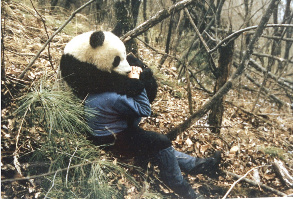
追蹤熊貓已久的呂植終於得到熊貓的信任，圖中為嬌嬌的第三胎「老三」正與呂植玩耍。

來。等待期間接收到戴在嬌嬌脖子上的追蹤項圈回傳的信號，得知牠就在不遠處。就這樣從早上九點到下午四點，遲遲等不到嬌嬌的呂植打算離開，而沒想到其實一直都待在石洞中的嬌嬌也終於不耐煩，從呂植腳下衝了出來，人熊之間的距離僅有2公尺。嚇得想轉身逃跑的呂植，想起在猛獸面前不能背對著逃跑，她只得強裝鎮定地面對嬌嬌，此時往呂植衝的嬌嬌停了下來，最後抓了呂植面前的朽木咬得破碎後轉身離開。「當時我回頭尋找身後的兩位助手，原來他們早就跑得老遠。」呂植笑了出來。