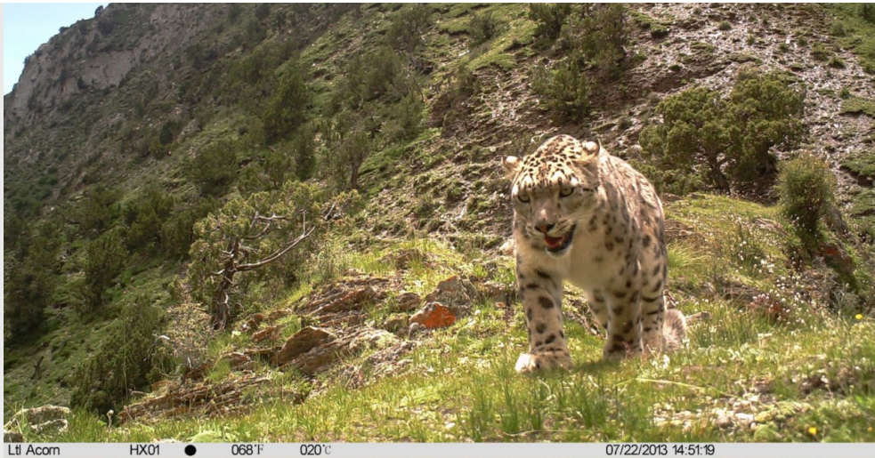
已成瀕危物種的雪豹，數量比熊貓還少。

在秦嶺保育熊貓時，村民會問呂植為什麼要保育熊貓。但是到了藏區沒人問這個問題，好像保護野生動物是理所當然的事。「青藏高原的野生動物是我看過最不怕人的，站在河裡魚會主動跑過來，是可以隨便抓起來研究一下再扔回去的。」呂植比手畫腳地說著。沒有被偷獵者嚇壞的野生動物，讓呂植看見人和動物和平共處的理想實踐。