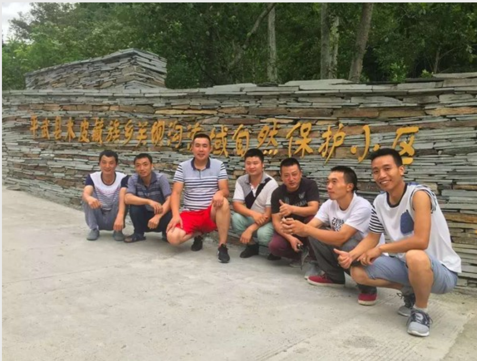
年輕人回村加入保育行動。

這件事深深地烙印在呂植心中，也體悟到如果想要保育熊貓，必須讓村民成為最主要的力量，達到人與環境互利互助的狀態。而為了讓村民主動加入保育行列，呂植想出了「熊貓蜂蜜」這個方式。透過收購當地的蜂蜜，並將販賣這些蜂蜜的收入再回饋給當地保育熊貓小組。保育和經濟兼顧的循環，也促成當地的年輕人回村加入保育行列，有了這些年輕人的注入使保育行動變得相當活絡，「還曾有一位年輕人這麼告訴我，雖然在城裡的收入高一點，但那是在為別人做事，而他現在是在為自己、為家鄉做事。」呂植言談間透露著欣喜：「這是我沒有想到的效益。」