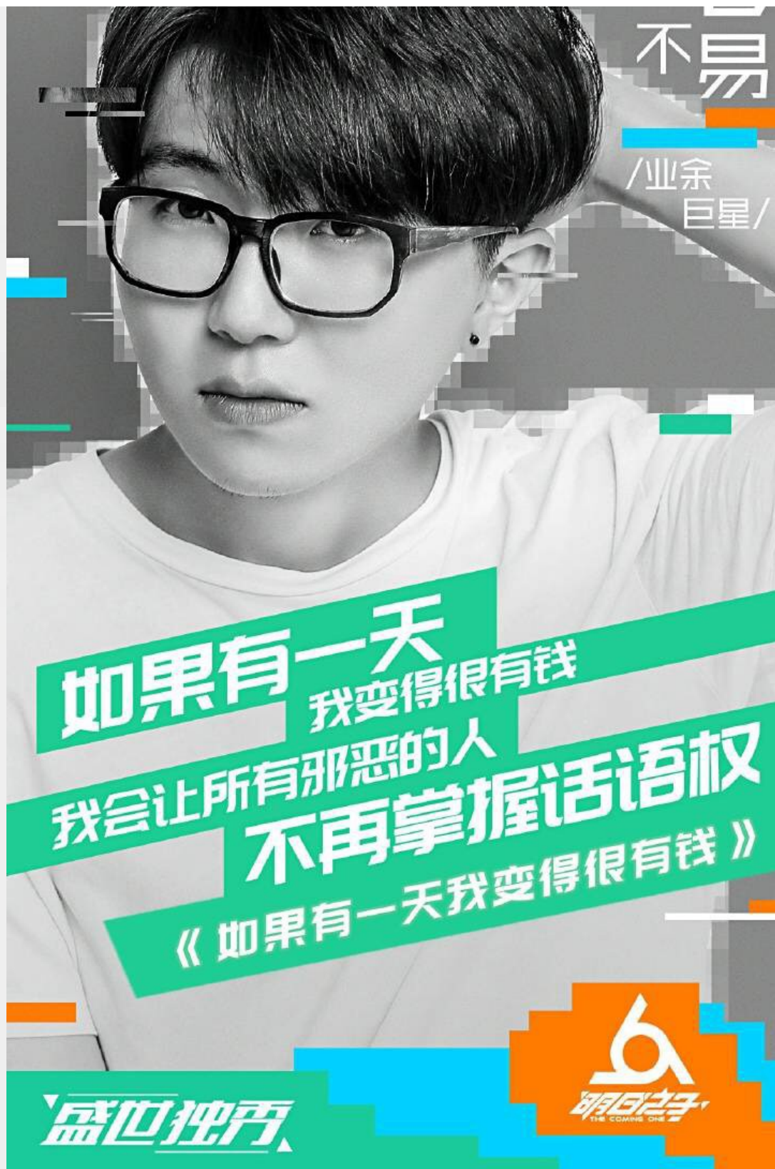
毛不易參加《明日之子》的官方宣傳海報。

對於大部分人來說，最簡單最實際的夢想，就是「變有錢」。有錢的人總說著錢不重要，但誰又知道沒錢的人整日為錢所惱的感覺呢？風涼話誰都會說，因為你不是當事人，所以不必感同身受，也不必負責任。這樣最簡單卻無人看破、說破的道理，毛不易用最歡快的語調唱了出來，詞曲中搭配專屬的口哨聲，看似雲淡風輕，實則刻骨銘心。