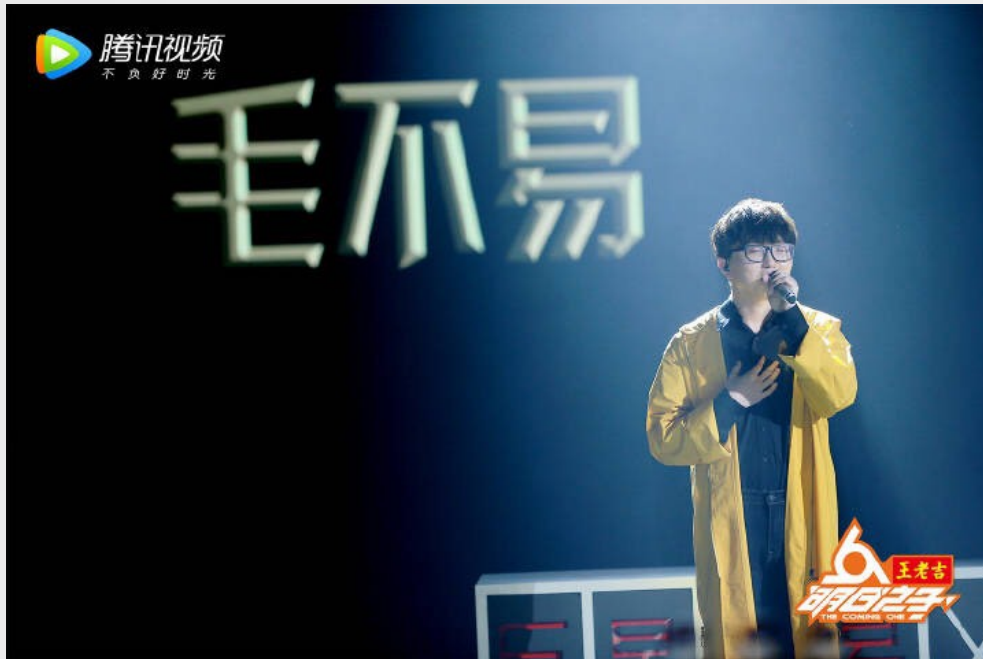
毛不易於《明日之子》總決賽演唱畫面。

一葷一素，代表著家中飯桌上簡單的飯菜，不是大魚大肉，足以溫飽，卻幸福的可以。最簡單的日常，不是崇尚物質，而是和那個在心上的人一起，儘管只是一同坐在樹下乘涼，晚風輕拂，仍舊勝過千山萬水。