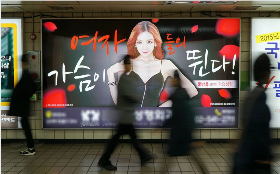
韓國整容廣告過度刊登，首爾地鐵宣布至2022年前，首爾所有地鐵站將禁止整容診所和醫院刊登。

《江南美人》此劇的釋出卻在這個外貌至上、不整容就無法跟別人競爭的社會引起漣漪，讓大眾對於整容話題重新檢視，更重要的是人對於「美」的價值觀。該劇主軸雖為校園愛情劇，卻也道出許多社會現實面、價值觀的殘酷現實，值得大家一同關注。