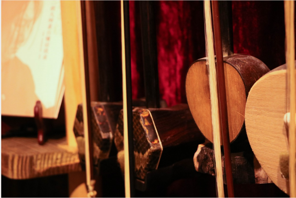
店內陳設的傳統樂器，黃苡哲心血來潮就會拿起來彈奏。

近年來隨著環境資源日益短缺，有許多樂器製作材料變得越來越稀少，比起製作樂器，黃苡哲更希望能藉由「修補」減少資源的浪費。對他而言，「修補」比「製作」樂器更開心，「樂器能繼續用就繼續用，我不會拗客人一直買新的。如果客人有能繼續用的舊樂器但他堅持買新的，我也希望他能將舊的捐出來轉售給其他想學樂器，但手頭不太闊綽的人。」這也是他在推廣傳統音樂的同時秉持的理念，傳統樂器象徵自己成長的土地，而我們需要透過「惜物」來守護，解決刻不容緩的現實問題。