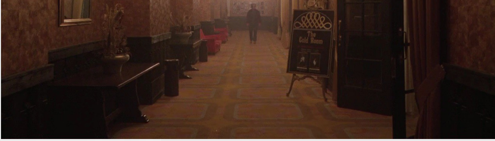
美國恐怖電影《鬼店》故事背景發生於科羅拉多州一間奢華又靈異的飯店。

雖都是凶宅，在日本卻有個獨特的「藝名」。在日劇《房仲女王（家売るオンナ）》第六話中，一間透天豪宅竟只賣日幣一千萬（約台幣三百萬），因其為妻子殺了外遇丈夫後自殺的凶宅，劇中稱之為「心理瑕疵物件」，意即物件本身「物理上」沒有缺陷，「心理上」卻存有瑕疵。