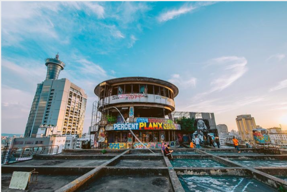
藝術家將千越大樓頂樓的飛碟屋當作畫布一樣盡情彩繪。

鬼月的禁忌是由人創造，而凶宅的價值與恐怖往往取決於人們心中的想法。這些被社會認為可怕的場所，棄之不顧的空間，隨著人們觀念慢慢改變，現今也有許多不一樣的風貌。如清大梅園，雖為創校校長梅貽琦的墓地，但更多人對此是抱持一顆敬畏的心。而在文章開頭提及的千越大樓，藝術創作團隊「逃亡計畫 Escape PLAN "X"」進駐於此成立工作室，五彩繽紛的塗鴉為這棟老建築注入新生命，也成為熱門的拍照、打卡景點。總而言之，文化價值觀僅是其中一種既定印象，凶宅真正的意義應由人們自己來賦予。