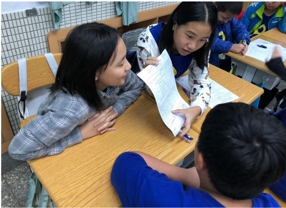
學生進行互相評分。

問及遇到最大的困難時，她二話不說表示時間不夠，不僅要喬出團隊開會討論的時間、隨時解決學生的問題，還要在上課之餘持續精進自己的能力，林姍姍犧牲了很多下班和午休時間，為的就是希望學生能真的學到對生活有幫助、帶得走的能力。她說：「真的很累，但當老師的就是有個通病，看到孩子們很高興時，就會很有成就感。」這股動力支撐著她繼續為學生設計好課程，就算辛苦，仍願意做，也推薦其他老師跟進。