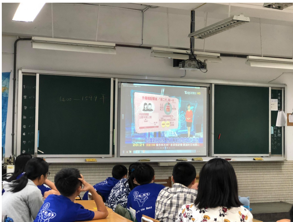
社會課中播放新移民的相關新聞。

因為學生在最後要小組合作產出關於新移民的報導，為了增添背景知識，所以在早自習、課堂時間都需要閱讀與新移民或移工有關的故事。令人驚訝的是，這裡的孩子們除了紙本閱讀外還透過平板數位閱讀。為了讓他們學習如何採訪、擬定問題大綱，老師們更邀請國語日報的記者進入教室教授訪問技巧，最後也實際邀請新移民到現場分享經驗，供學生採訪。林嫻奴提到：「這個環節打破孩子們對新移民的刻板印象，尤其讓他們了解到原來移民不一定貧苦，也不一定是在勞動階級，有可能是來留學、教外語或甚至上節目。」