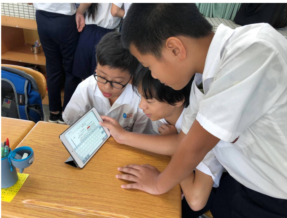
學生們使用雲端硬碟共同編輯報導。

習得知識、採訪技巧後，學生們必須撰寫報導，他們以雲端硬碟共用文件的方式一起編輯版面及內容，乍看之下就像是大學生在做報告。但並非所有學生都能完成老師的每個指令，有的可能語文能力沒那麼好或者數位能力較低落等，「這時候老師的教學知能很重要，除了要在教學領域有專長外，還要有教學背景去同理學生的問題並幫助其找到解決方法。」林姵妏說，過程中不僅學生在學習，老師也在做中學，以滾動式修正的方式讓課程變得更好，也就是今天遇到問題後馬上與團隊討論，隔天立即做出修正。