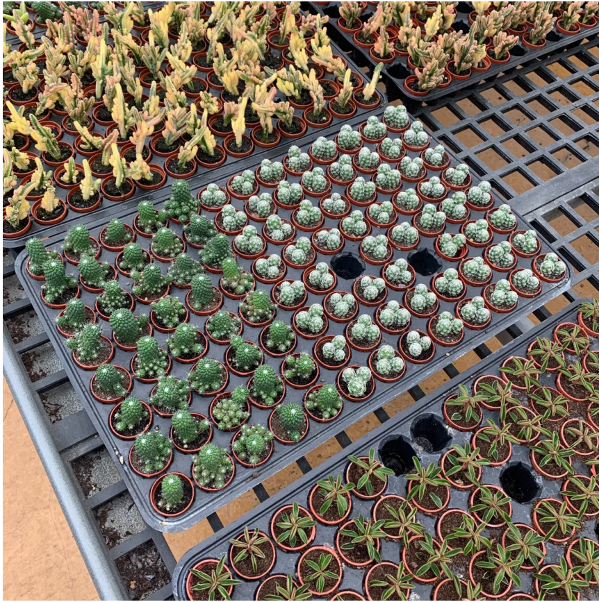
▲ 一时的小型多肉盆栽，很適合擺放至書桌或辦公桌，讓努力工作之餘的人們，獲得片刻的療癒。