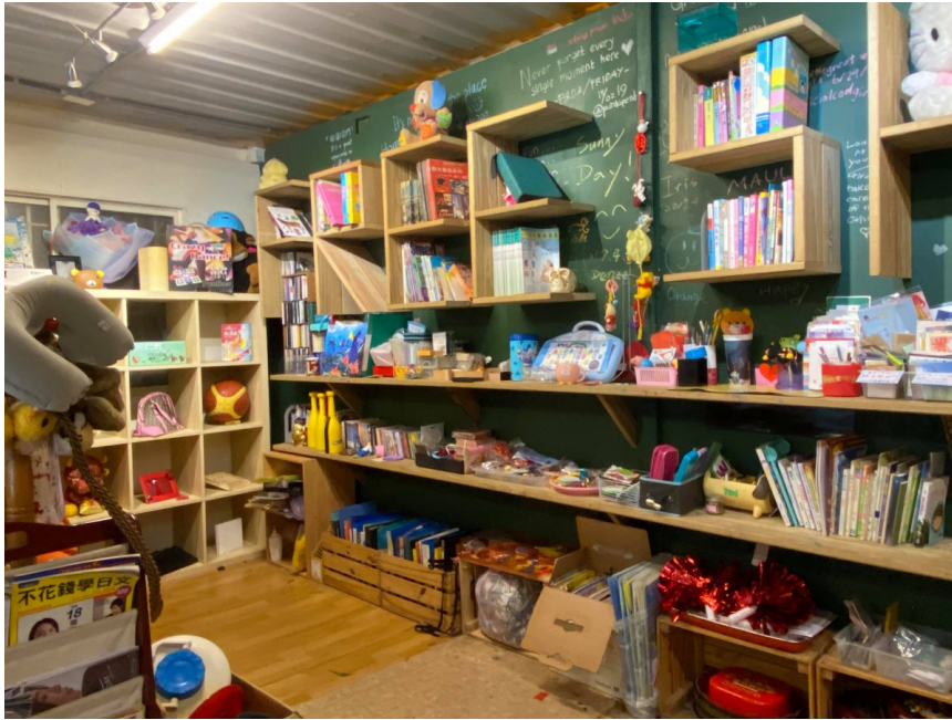
▲ 免費商店裡擺滿琳瑯滿目的物品，如布偶、漫畫、書包、餐具、各式文具用品皆應有盡有。