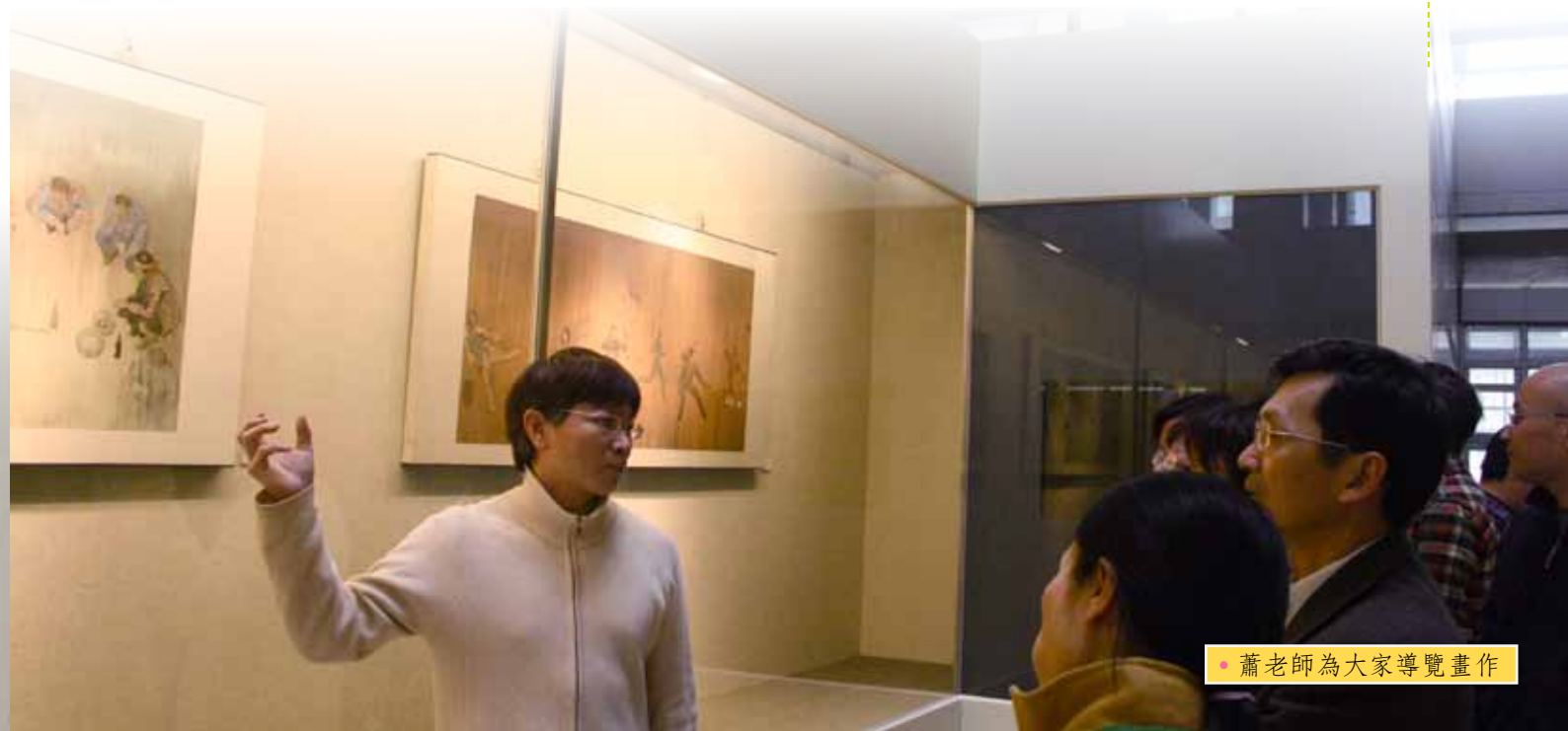
● 蕭老師為大家導覽畫作