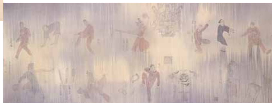
神兵火急如律令 .IV 水墨、紙本、礦物顏料、鹿膠 93X180cm 2010 (圖二)