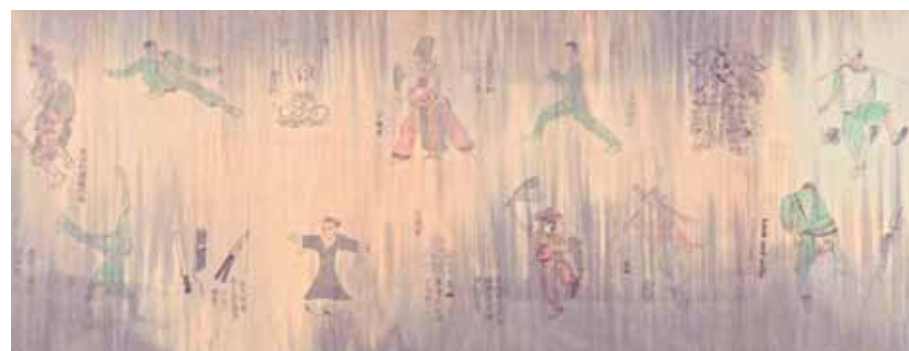
神兵火急如律令 .II 水墨、紙本、礦物顏料、鹿膠 93X180cm 2010 (圖三) 蕭巨昇老師提供