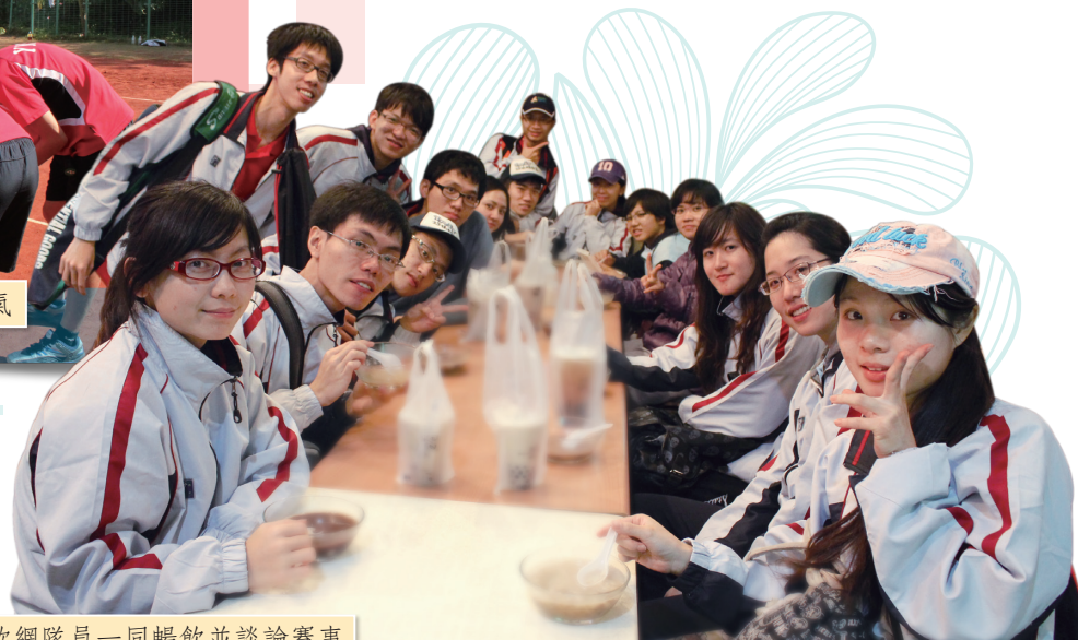
• 軟網隊員一同暢飲並談論賽事

提醒自己和身邊的夥伴們。感謝這次一同參加大專盃的所有同伴們，不論他們有沒有上場，後續軟網隊也需要學弟妹們的成長與接棒，所以也要努力培養未來的支柱。