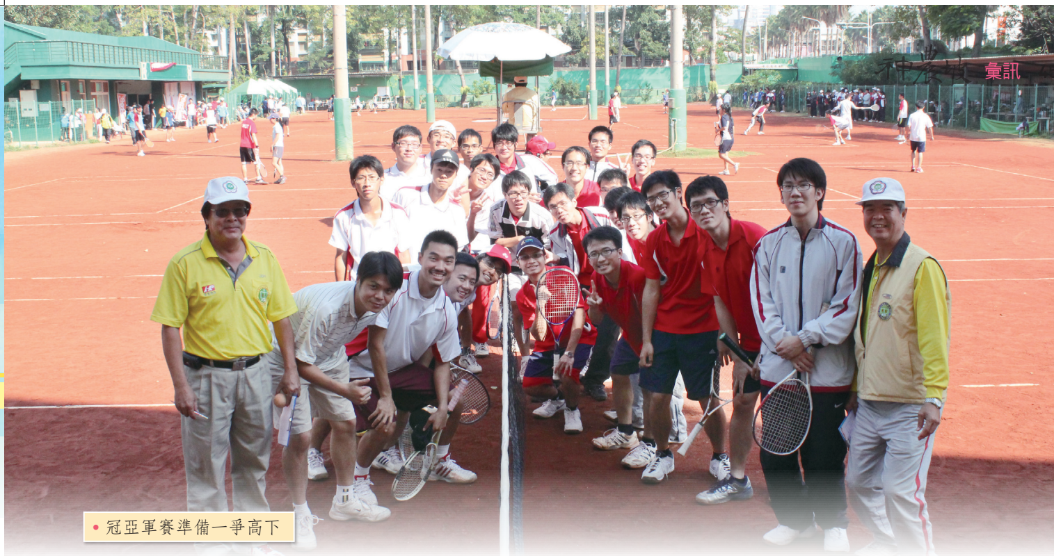
• 冠亞軍賽準備一爭高下

第二天開始的團體賽其實才是我們的重點，因為除了有排點的考量外，也是和敵方鬥智鬥技的過招，為團隊和學校贏取榮譽！看隊長和學長們討論戰術和費心盤算，無不是為了佔有最大的勝率。