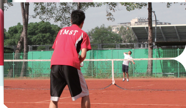
• 混雙決賽，選手戰戰兢兢

而比賽時，球技固然重要，但是心理狀態和球感也具有決定的因素，氣勢能否維持不墜也佔有一席之地，來自身後加油團的打氣是我們的強心劑。一如教練所說的，要將「練習當比賽、比賽當練習」才能達到最好的練球效果和比賽心態，這是我們隊上要一起努力的方向。我也希望在比賽中，可以順便觀察各校的球風，互相交流，與自己的隊友們一起努力，我想老了以後，會忘記當初對手長什麼樣子，輸了幾點，但一起出來比賽的情誼是永不磨滅的（這也是陽明軟網校友盃，每年都可以這麼熱鬧的原因）。