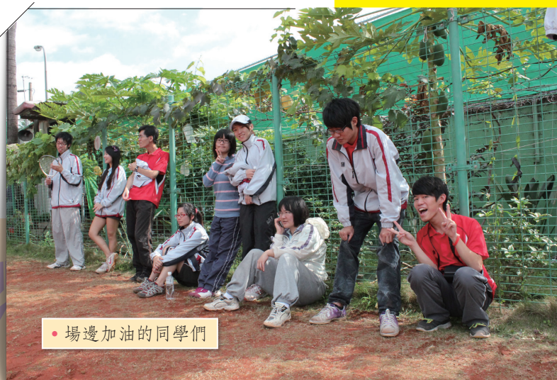
• 場邊加油的同學們