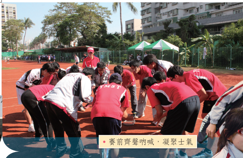
• 賽前齊聲吶喊，凝聚士氣