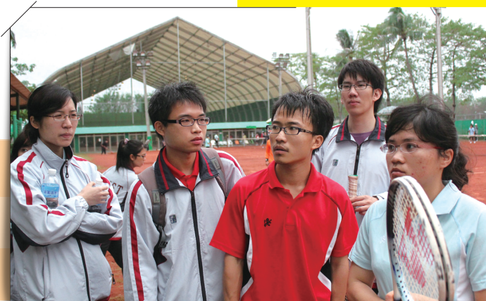
• 聆聽教練臨場戰術指導

記得小時候老師曾說：「演什麼就要像什麼，用心，就可以去詮釋一個與自己截然不同的角色」。雖然這個目標總是差那麼臨門一腳，有時結果看似不錯但好像可以更好。這次的大專盃，我想我做到了，雖然喊聲有點誇張，但我學會了在球場上如何毫無保留地去證明自己的能耐，學會了如何扮演一個競技場上的運動員。場上的表現還是要靠場下經驗的累積和實力的磨練。這要感謝體育室的幫忙還有隊友的敦促，讓我賽前兩個月幾乎都能進行扎實的訓練，也能維持好的球感。其中特別想要分享的是練球的方式很重要，比起時間，練了哪些東西才是進步的關鍵。