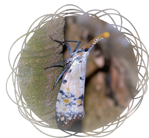
• 渡邊氏東方蠟蟬 / 吳慶祥

順著坡道往上走，左邊圍牆缺口的前方有三棵烏柏樹，樹幹上可找到渡邊氏東方蠟蟬（又名渡邊氏長吻白蠟蟬）。此昆蟲長相古怪，前額像是提著一盞黃色的燈籠，在2009年4月之前都還被農委會列為『保育類昆蟲』。從東華公園到校內環山