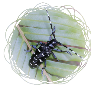
• 星天牛 / 吳慶祥