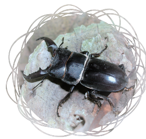
• 扁鍬形蟲 / 吳慶祥

若不走階梯步道可右轉到活動中心前面廣場，在空橋的下方偶而可以找到扁鍬形蟲，猜測也是被夜晚的燈光吸引而來，在整個唭哩岸山區包括東華公園與軍艦岩，這是目前記錄到唯一的一種鍬形蟲。事實上，夜間若來到布查餐廳螺旋階梯下方，被燈光照射的泛白牆面上會吸引許多趨光性昆蟲，尤其是一些小型天牛，如：家天牛、鑹斑天牛、六星白條天牛、星胸黑虎天牛等，在此都有機會找到。階梯步道的第一段止於神農坡路，走上神農坡路前記得瞧一眼左邊樹下的山芙蓉，秋季開白花，紅心黃蕊花型大且耐看，偶而會有熊蜂在附近活動。往年這裡也有不少大青銅金龜，今年似乎較以往少了些。是否與校園內頻繁的除草有關，就不得而知。