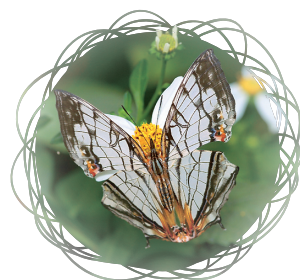
• 石牆蝶 / 吳慶祥

沿坡道繼續往上來到環山道路駁坎下方的籃球場，筆直的小徑右側到另一側的駁坎之間是一大片草叢，長著許多認得出來與叫不出名的野花，而雜樹林裡有烏桕、樟樹、相思樹、構樹、山黃麻、圓葉血桐分佈。草叢周遭常見跳躍的小蚱蜢與飛舞的蝴蝶，紫蛇目蝶、紫斑蝶、豹斑蝶、三線蝶、樹間蝶等都是這裡的常客，夏日裡更少不了高砂熊蟬在樹上竭力嘶鳴。沿著小徑走到攀岩場右側，拾階而上就是一處寬闊的木製觀景台，旁邊的山櫻花盛開時極為漂亮，花謝之後滿樹的小櫻桃常吸引成群的綠繡眼到此覓食。觀景台正對面靠山側有一棵苦楝樹，四月左右會開出紫色的小花，淡而不豔，隨風搖曳極為優雅。