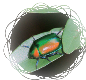
• 台灣青銅金龜 / 吳慶祥

我在唭哩岸山區記錄到的還包括：台灣青銅金龜、小青銅金龜、紅腹青銅金龜、綠豔白點花金龜、銅豔白點花金龜、台灣小綠花金龜、台灣琉璃豆金龜、姬甘蔗金龜、毛翅黑金龜、黃腹黑金龜、台灣巨黑金龜。在所有鞘翅目的昆蟲當中我最欣賞的就屬金龜子，牠們的色彩豐富光澤多變化，陽光照射之下其豔麗的程度絕不輸彩色寶石。