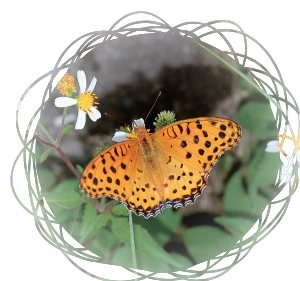
• 豹斑蝶 / 吳慶祥