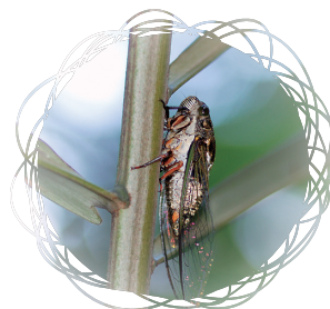
• 高砂熊蟬 / 吳慶祥

若從學校的正門口步行上山，博雅中心後方單身宿舍旁是『階梯步道』的起點，往左通往環山道路，往右走可通到活動中心前面的廣場，或順著車道上山。階梯步道兩旁的小葉欖仁挺拔參天，枝葉茂盛遮蔭涼爽。每年端午節前高砂熊蟬從蟄伏的地底鑽出之後，就持續地鳴唱夏日樂章直到入秋為止。牠們是陽明校園內最常見的大體型鳴蟬，黑色的軀體覆蓋著極易脫落的金綠色鱗毛，橙黃色的腹瓣，很容易辨識。一路往上都不難發現沾滿泥土的蟬蛻，或在樹幹上或在燈桿上。隨著氣溫漸漸轉熱，掉落在步道上的死蟬也愈來愈多，通常看到完整的標本我會撿回去裝盒保存。