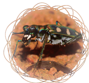
• 八星虎甲蟲 / 廖智安

走上階梯之後就可以沿車道通往藍楹軒，這條上山的路線人車較少，算是校園內蟲況較佳的區段。由於環山道路整修擋土牆自去年四月開始封路施工，未來隨著教師職務宿舍、學生宿舍與游泳池新建工程陸續展開，唹哩岸山西側的校區預料將會有全然不同的新風貌。環山道路施工路段附近邊坡上的樹木已全部砍除，趕在封路前我從砍倒的馬尾松摘回幾顆松果，留做紀念。