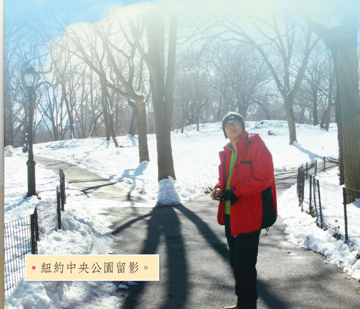
• 紐約中央公園留影。