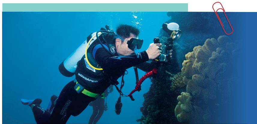
• 在澳洲大堡礁拍攝海底景物