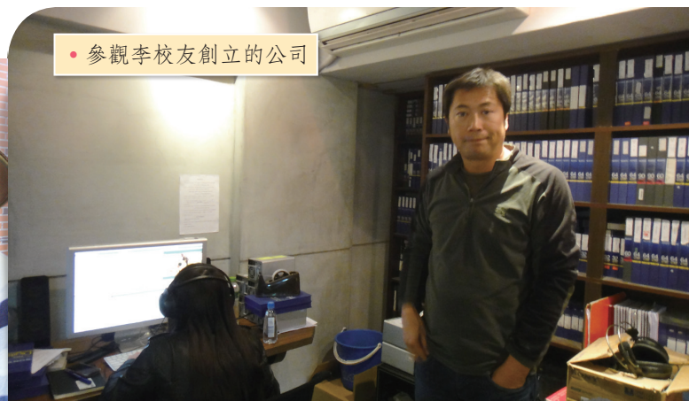
• 參觀李校友創立的公司