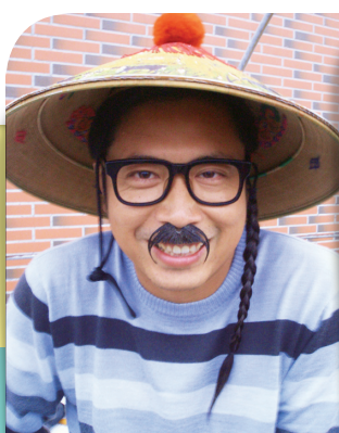
• 媽祖出巡報馬仔裝扮