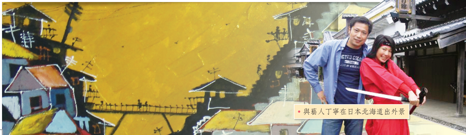
• 與藝人丁寧在日本北海道出外景