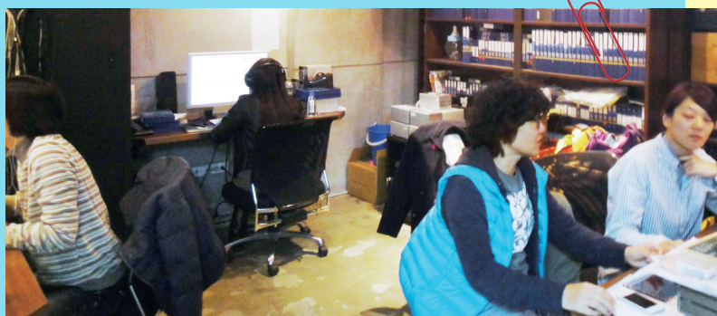
• 動能意像公司剪接室