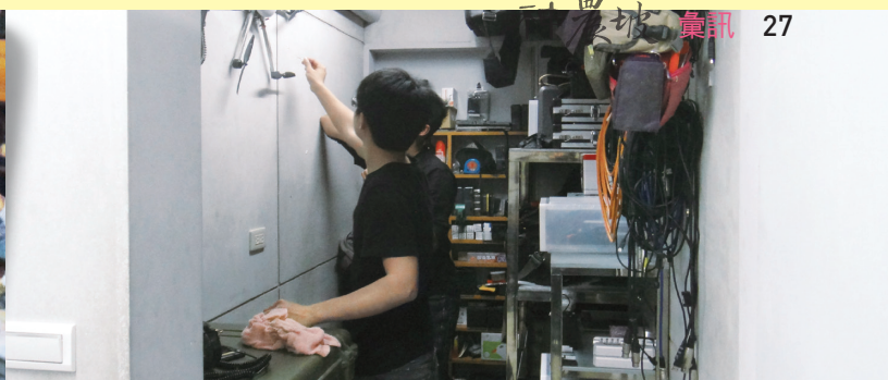
• 動能意像公司攝影器材室

當時有家廣播公司需要成立粉絲團，因為我在學校有組織社團的經驗，朋友就介紹我進入這家公司工作。一腳踏入傳播業，我開始喜歡企畫工作的挑戰。後來加拿大 University of British Columbia 通知我入學，但是原本的指導教授因為要出國進修，我的研究工作也暫時延後。