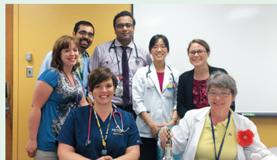
● 病房每天的跨領域會議集合醫師、護理師、個案管理師、藥師、社工，大家共同創造全人照顧的醫療環境

第一次看美國職棒大聯盟的比賽，跟著全場觀眾一起加油吶喊，那心中的興奮和激動可真是難忘。