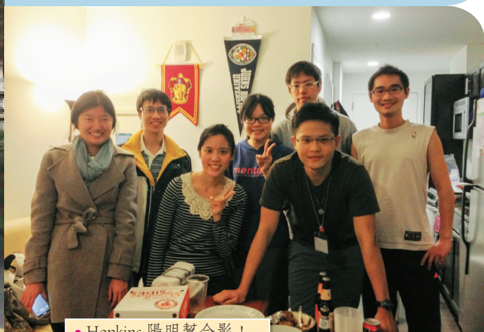
● Hopkins 陽明幫合影！