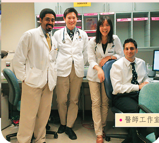
● 醫師工作室是大家經驗交流的地方

我的見實習是從心臟內科開始。前兩個禮拜跟心內病房團隊，後兩個禮拜則是跟著心內會診團隊在偌大的醫院到處看會診。在病房的時候，學長姐會分配2-3床病人給我，每天我要找時間自己看病人、做理學檢查、寫病歷，然後在早上整個團隊一起查房的時候報告病人的進度和我的評估。以往我對自己做口頭報告的能力是相當有自信的，可是到了國外，就發現自己不只英文比別人菜，連內容也零零落落。不過這也給了我一個很好的進步機會，透過每次報告完學長姐和老師給我的回饋，漸漸我也越來越能抓到口頭報告的重點，越報越流暢！身處國外也才發現，很多在台灣習以為常的醫學英文，發音都是錯的！我花了好一段時間才把自己的錯誤發音給校正成美國人聽得懂