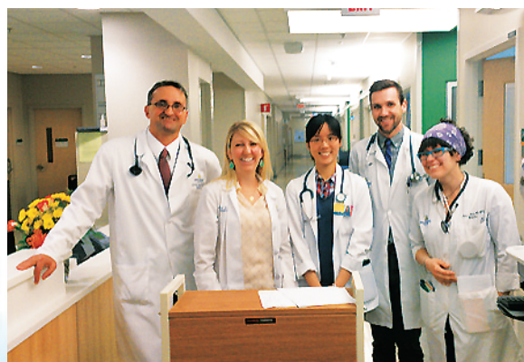
• General cardiology team 查房倩影