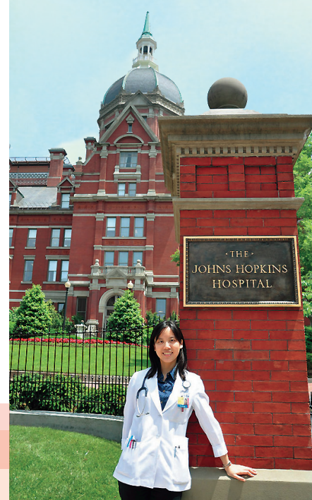
● 能到 Johns Hopkins Hospital 實習，彷彿美夢成真啊！