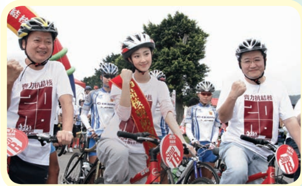
● 郭老師（右一）參與結核病防治宣傳活動