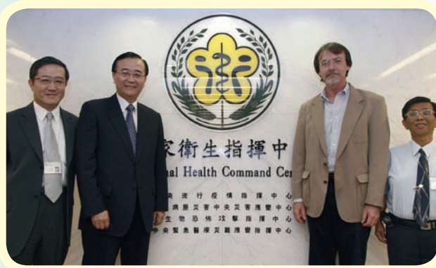
● 郭老師（左一）是國家防疫的尖兵