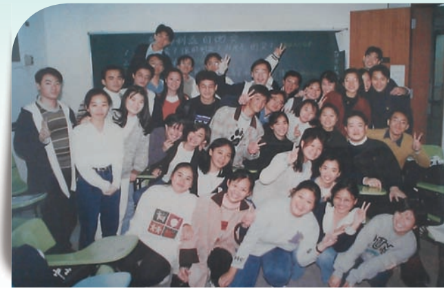
• 郭老師以學長的心態輔導醫學系學生

編輯： 郭老師在學校擔任過醫學系副主任、社會醫學科主任、主秘等職務，請老師談印象中最深刻的一件事，而且對學校日後有深遠影響？