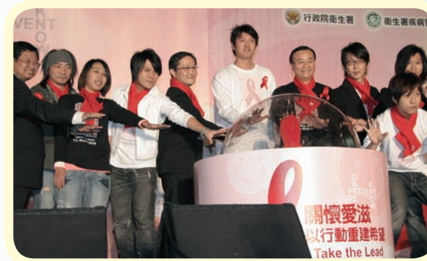
● 2007年於「世界愛滋病日」在101大樓點燈