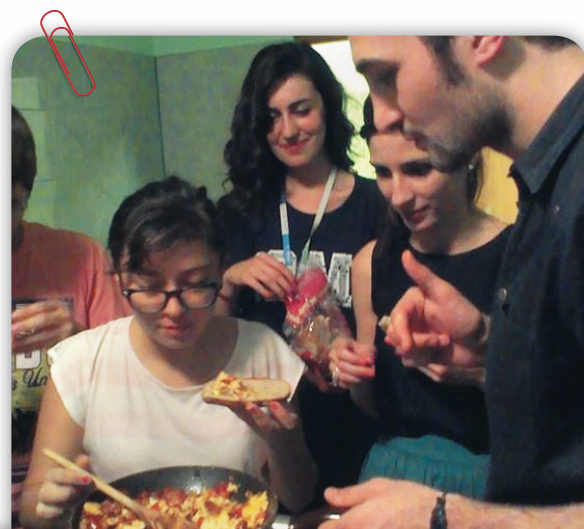
● 品嚐西班牙與巴西交換學生的好手藝

這次的研究交換經驗對我而言是永遠難忘的回憶，除了研究經驗方面的收穫，也讓我認識許多來自其他國家的 SCORE 夥伴，因此我非常推薦尚未體驗過 SCORE 而對於研究與不同文化生活有熱誠的同學去嘗試與體會！