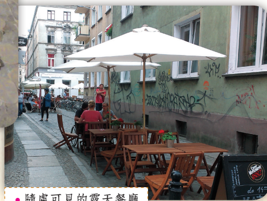
● 隨處可見的露天餐廳