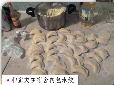
● 和室友在宿舍內包水餃