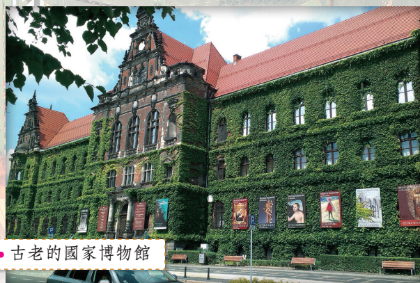
● 古老的國家博物館

由於待在實驗室的時間為平日九點到下午兩點，因此我可以趁著平日下午的空檔和周末在 Wroclaw 探索。據 2013 年的統計，波蘭人口約 3864 萬人，國土面積約 31 萬平方公里，人口只多台灣約 1.5 倍，面積卻比台灣大十多倍，人口密度相當稀疏，因此交通工具主要以長距離運輸的路面電車、地鐵與汽車為主，在熱心烏克蘭和同樣來自台灣的室友幫助下，我很快熟悉交通工具。波蘭的地鐵和巴士非常方便，站牌都有清楚的站名與時刻標示，站牌旁也幾乎都有販售車票的基台，密集交織的交通網讓我很容易到達諸多觀光景點。