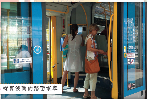
● 縱貫波蘭的路面電車