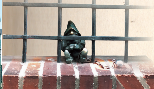
● 隨處可見的小矮人