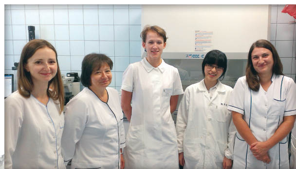
● 實驗室溫柔的助理姊姊們（右 2 為作者）

在短短一個月的學習中，我學習到如何檢測患有慢性腎臟病合併免疫風濕疾病患者的補體活性，並進一步利用醫院病歷系統的數據分析患者們的年齡、性別、腎臟功能與免疫能力；此外 Banasik 教授也給我隨 Wroclaw 住院醫師與醫學生一起查房，為病人進行理學檢查的機會，讓我對波蘭醫學教育體系與醫病關係有更進一步的了解。