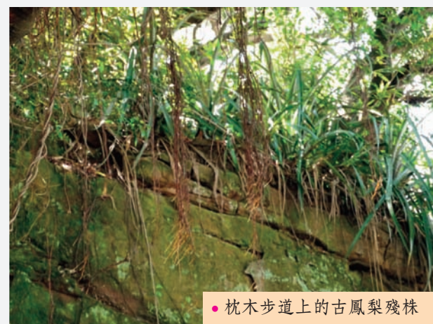
● 枕木步道上的古鳳梨殘株

根據劉克襄老師的描述，台灣栽種鳳梨的歷史可追溯到十六世紀末，閩客族群引進栽種於鳳山，可能同時引進北投栽種於唭哩岸地區（那麼就有三百多年歷史）。