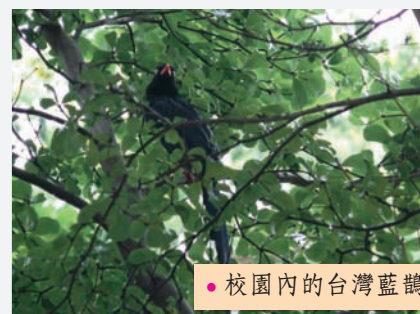
● 校園內的台灣藍鵲

若不曾探尋久居陽明的住民，那麼請走出戶外擁抱這塊土地、珍惜他們的家，也是我們的家。還是我們只想當個四年、六年還是七年的過客？