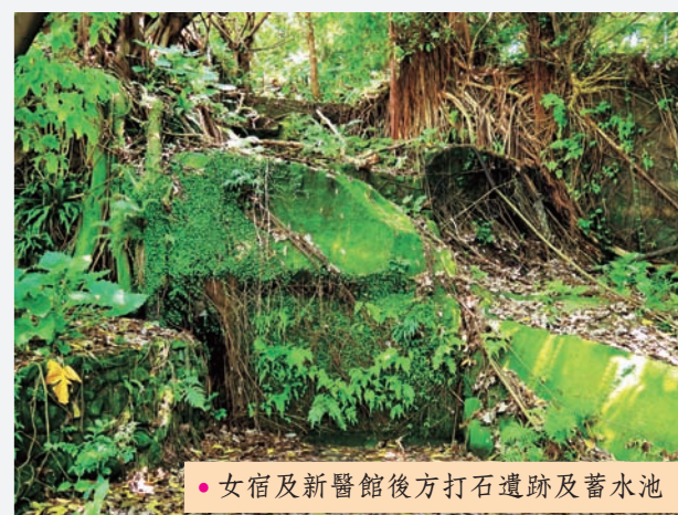
● 女宿及新醫館後方打石遺跡及蓄水池

有人疑問到底學生能做到什麼程度，或自我質疑我們力量是否足夠？學生的力量不容小覷，北投溫泉博物館從一個廢墟，透過當地小學師生不斷努力進而成為現今光景，串連北投當地人文發展及在地景色。前面的故事、生態風景只是「唭哩岸計畫」一個起點，我們要尋找唭哩岸失落的一環，鑑古知今了解在地歷史，發揮陽明獨特人文特色，透過尋找校園結合地方歷史、共創地方風情，讓陽明大學與唭哩岸更緊密地連結。