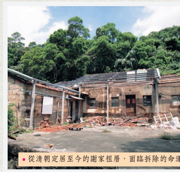
• 從清朝定居至今的謝家祖厝，面臨拆除的命運