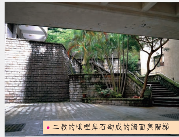
● 二教的噶哩岸石砌成的牆面與階梯