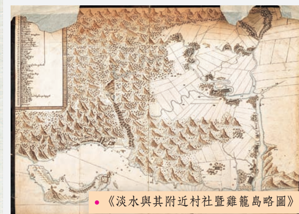
● 《淡水與其附近村社暨雞籠島略圖》