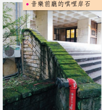
● 音樂前廳的噶哩岸石