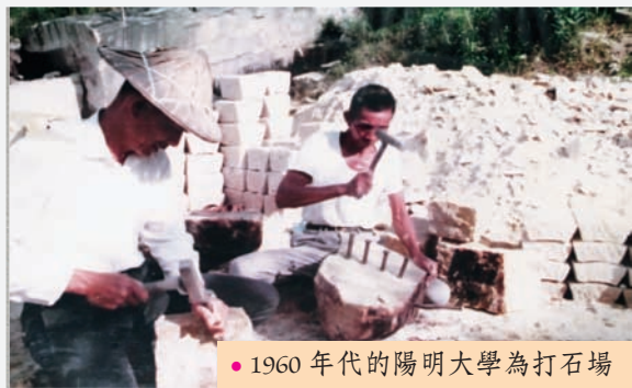
● 1960 年代的陽明大學為打石場