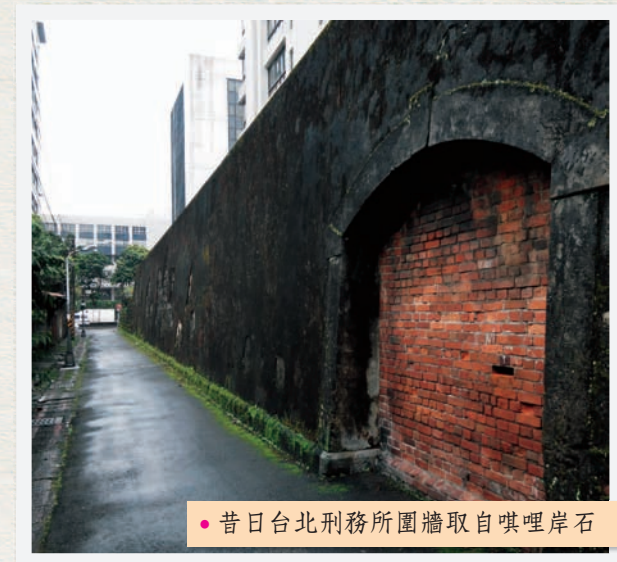
• 昔日台北刑務所圍牆取自唎哩岸石

唎哩岸山載負重要的記憶遺跡，形成於兩千三百萬年前左右的中新世，屬於木山層，是砂岩及頁岩交錯層，包含碳層。山巒背風側的唎哩