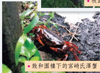
● 致和園樓下的宮崎氏澤蟹