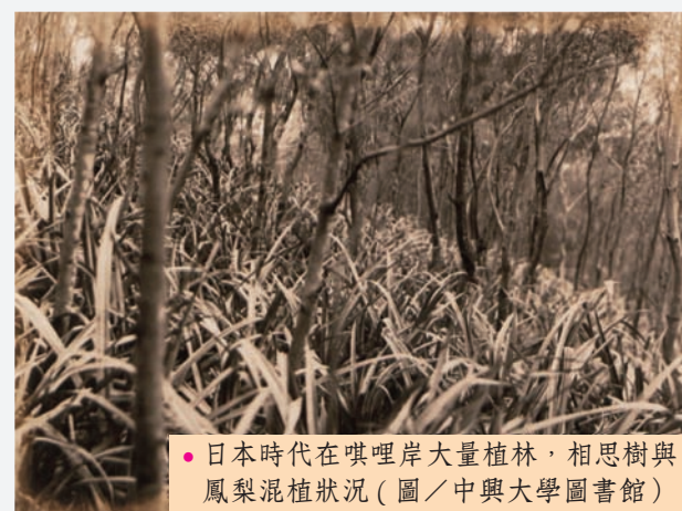
● 日本時代在唭哩岸大量植林，相思樹與鳳梨混植狀況（圖／中興大學圖書館）

除了熟知的鳳凰木、樟樹和台灣欒樹，校長官舍旁的枕木步道峭壁上至東華公園上種植著台灣土鳳梨。在日本時代，北投地區放領土地大量種植鳳梨，面積有四十甲之多，最遠曾經栽種至軍艦岩一帶，造就唭哩岸山有「鳳梨山」的稱呼，仍可見近百年歷史老殘株的蹤跡。