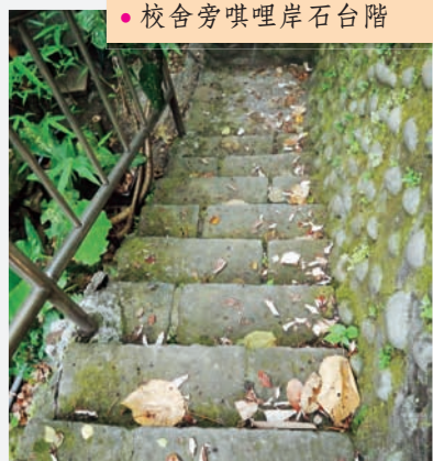
● 校舍旁噶哩岸石台階