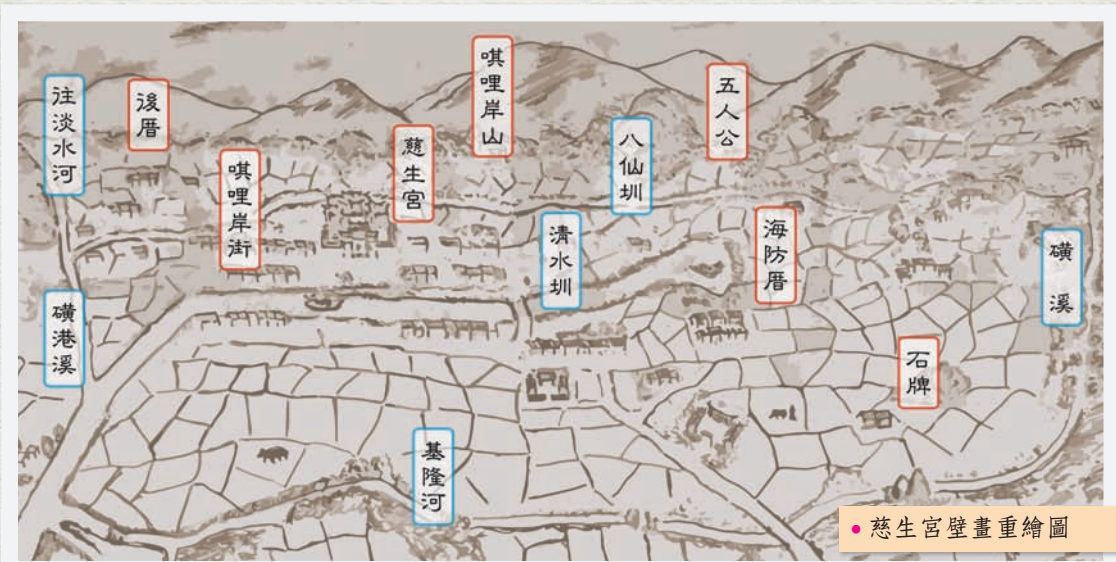
• 慈生宮壁畫重繪圖

憩場域，更為農產品、經濟作物、蘭草等的集散地，市集發展使唎哩岸街有「九萬二七千」的美稱，形容此地萬金富豪九位，千金富豪二十七位。隨台北城建城，以唎哩岸石做為城牆基石，後考量就地取材之便取大直及內湖的石材為主。當時磚頭仍不普及，因建材所需而造就唎哩岸地區的全盛期及陽明大學打石山傳奇。當時唎哩岸山區附近被視為蠻荒之地，雖西側裸露的岩石被大量開採，但附近治安不佳，強盜藏匿山洞，而有土匪窩之稱（今北榮後面一帶）。日本時代以「唎里岸」之名定了下來，台北城牆開始拆除，城牆石便作為當時行政區圍牆等的重要建材。同一個時期的淡水線鐵路，增設唎里岸停車場（車站），讓在此出產的唎哩岸石外銷帶來了更大的便捷性。《台灣督府研究所報告》記錄當時每才十六錢的親民價格且容易加工的特色，促使僅產自唎哩岸的石材遍佈台北城，也因耐高溫不易爆裂而作為軍工業冶煉的窯材。