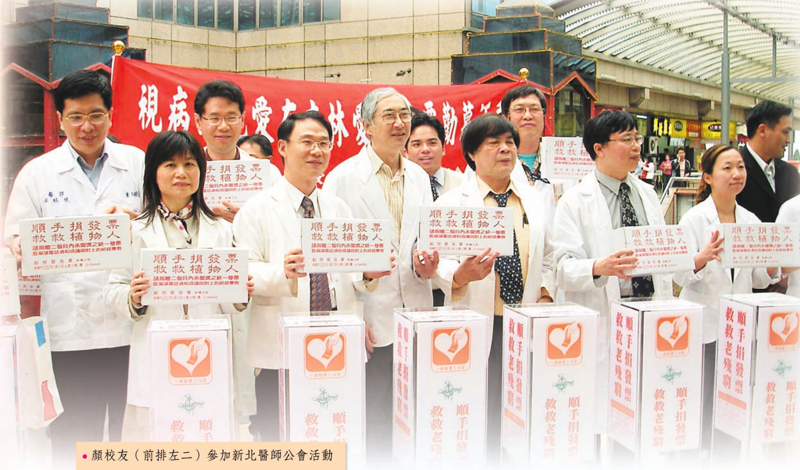
● 顏校友（前排左二）參加新北醫師公會活動

相對於單純的看診，「經營管理」需要長期投入心力，因此，不是每個醫師都願意接受管理職帶來的無形壓力。我們因為是本來就選擇走連鎖診所這條路，所以一開始就有這樣的心理準備。