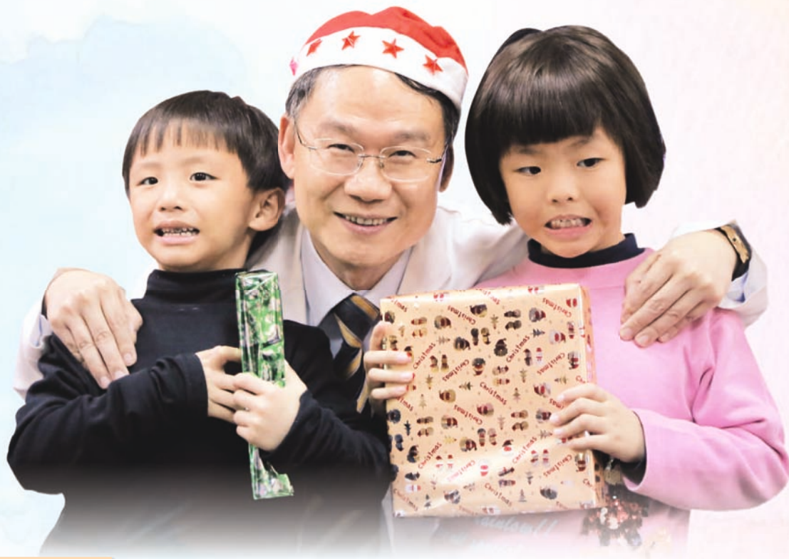
● 與愛心育幼院院童