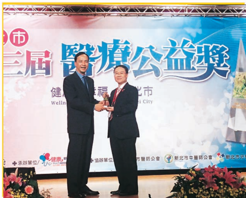
● 獲 2014 年新北市醫療公益獎