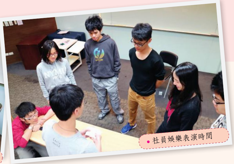
● 社員娛樂表演時間

以上關於學術部分的介紹，可能會使其他有意一窺「模聯」究竟的同學望之卻步。其實，陽明模擬聯合國社團除了豐富而完整的學術訓練外，其餘活動也十分精采：除了不定時的社遊活動外，我們固定於期末舉辦聯繫社員與學長姐感情的聚餐會談，也曾舉辦過電影欣賞同歡會，以不同的形式培養社團向心力，在學術的招牌之外更增添幾分人情溫暖。