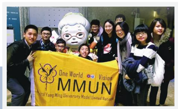
● 陽明模聯社參加公視《爸媽囧很大》節目錄影

在模聯社中，最重要、最核心的，便是模聯的學術訓練。在一整年的社課中，我們主要分為兩部分：上學期主要在提供社員模聯的基本知識，並熟悉議事規則；透過學長姐對特定議題的討論，慢慢深入模聯的運作，並培養參加模聯會議的諸多基本能力，且以每年十二月由台大模聯社舉辦的、全國學術層級最高的「泛亞洲模擬聯合國會議」（Pan Asia Model United Nations）作為學期目標而訓練。在一整個學期的訓練過程中，除了偏知識性的講述與技術性