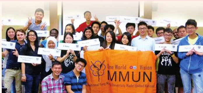
• 首屆「神農模擬聯合國會議」

模擬聯合國會議，簡稱「模聯」，是透過模擬實際聯合國會議的方式，讓學生了解並試著思考國際問題的現況與解決方法。其源起是哈佛大學於二〇年代由學生發起的「國際聯盟論壇」，為的是培養學生的國際視野與思維。