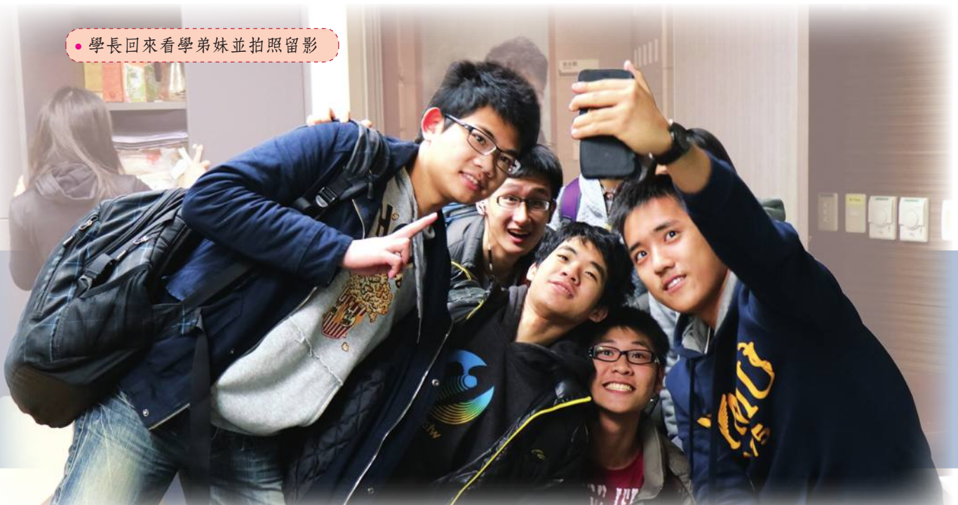
● 學長回來看學弟妹並拍照留影

綜合以上，陽明模聯社不僅是個學術氛圍濃厚的社團，更是個讓你與優秀同學、學長姐認識互動的良好媒介！如果你對於國際議題、模聯會議深感興趣，或是純粹想一窺模聯會議的究竟，歡迎追蹤陽明模聯的 FB 粉絲專頁（陽明大學模擬聯合國社團），並隨時發問。我們的例活是每周二 19:30-22:00 在新醫學館 201 室，誠摯歡迎各位有志之士的加入！