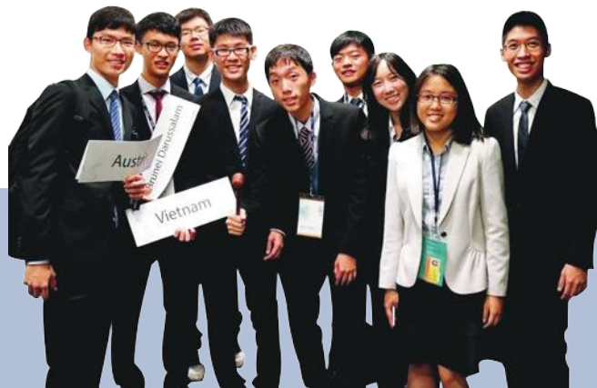
• 陽明模聯社社員於第六屆泛亞模聯會議的「東南亞協區域論壇委員會」合照