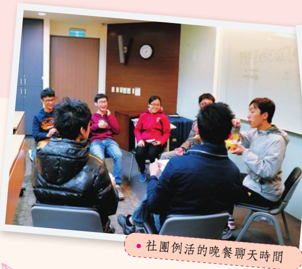
● 社團例活的晚餐聊天時間