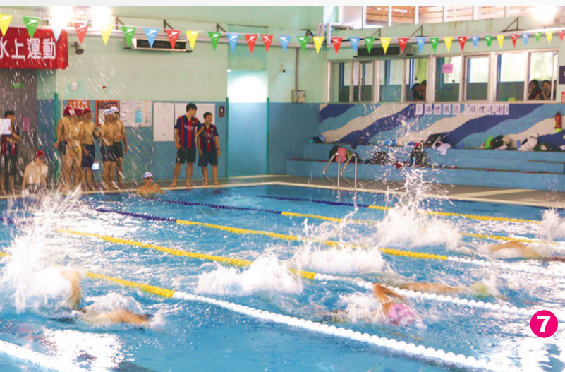
7 & 8 各個選手有如水中蛟龍，爭相奮泳前進