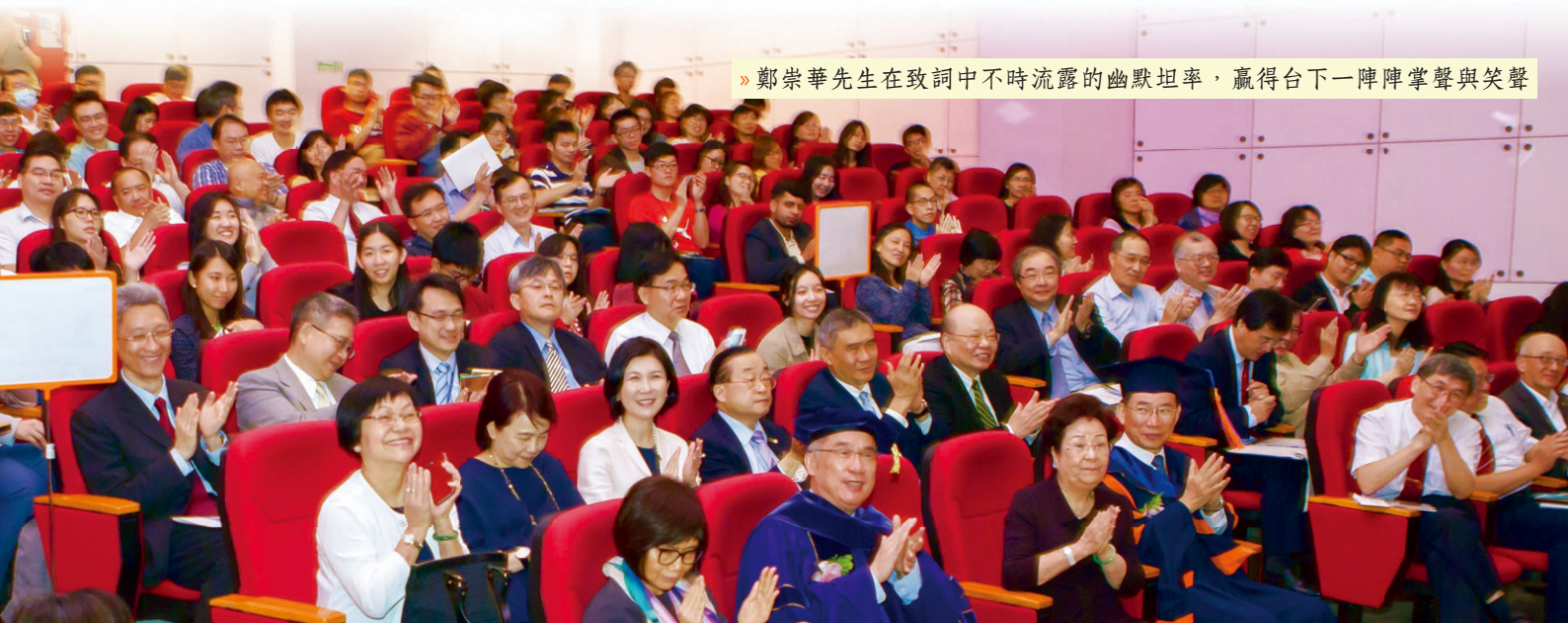
» 鄭崇華先生在致詞中不時流露的幽默坦率，贏得台下一陣陣掌聲與笑聲

是，解決問題的過程，其實就是鍛鍊自己能力的大好機會，因此不要害怕、放棄，「只要堅持下去，當你排除越大的困難，就會得到越大的成就感，同時也建立更強大的自信心。」他也提醒同學們，畢業後可能會有個心態，就是每天做同樣的工作會覺得有點枯燥，甚至有點失望；但實際上，日復一日的累積、越深入之後，對於如何把工作做好就會很有心得；像他自己從累積的經驗