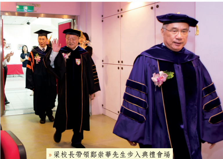
» 梁校長帶領鄭崇華先生步入典禮會場

在經營績效方面，40多年來，鄭崇華先生秉持企業家精神，率領台達集團求新求變，使台達成為電源管理與散熱解決方案的世界級廠商。在履行企業社會責任方面，面對全球暖化與氣候變遷的危機，鄭崇華先生率領該集團長期關注環境議題，持續開發創新節能產品及解決方案；