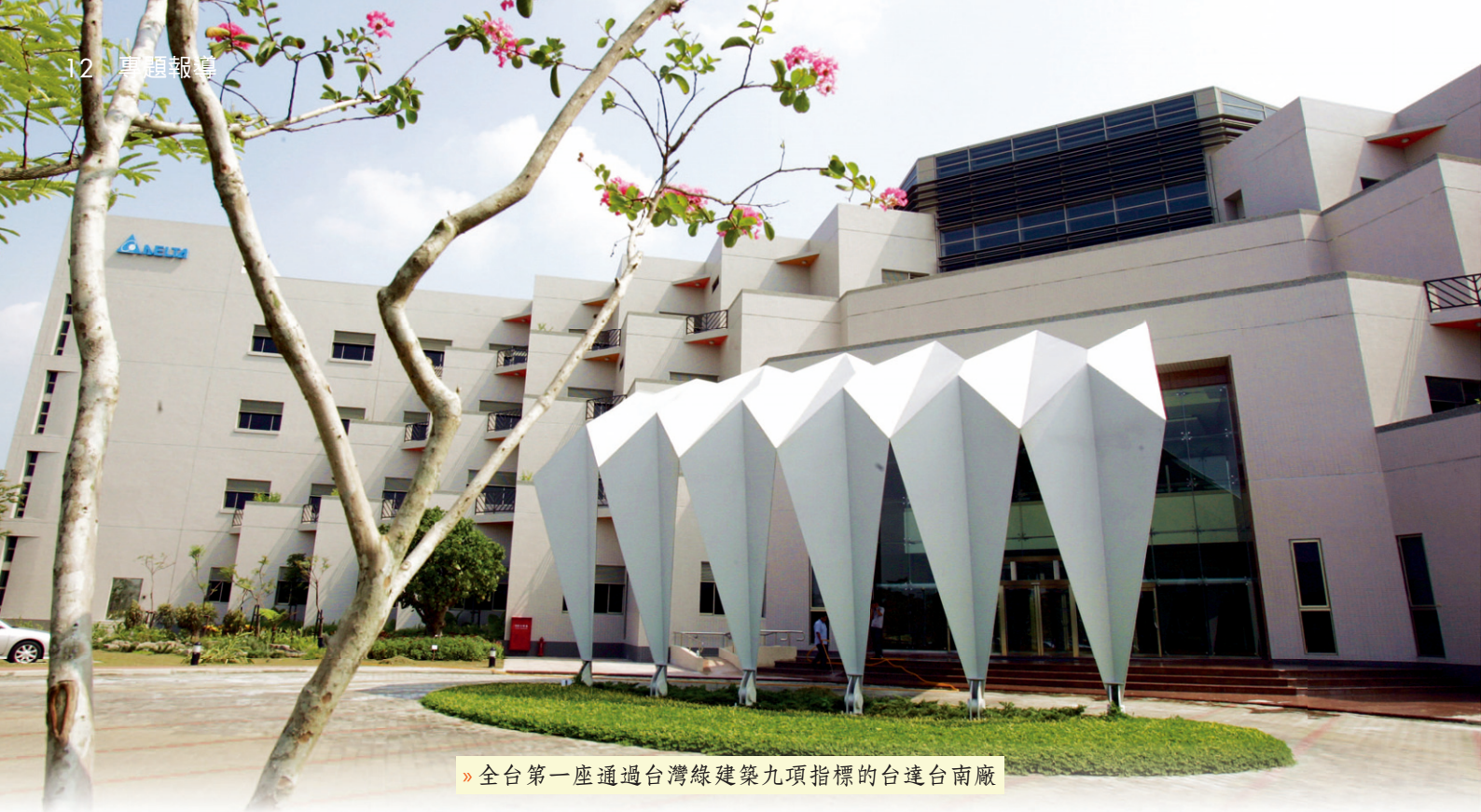
» 全台第一座通過台灣綠建築九項指標的台達台南廠

候，都要把握機會不斷學習、吸收，才能面對接踵而來的挑戰。他表示，其實自己能順利創業，就是因為從工作中學到很多跨領域的東西；從生產、工程到品管，甚至到會計，都為他累積了許多創業的能量跟經驗。