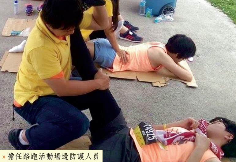
» 擔任路跑活動場邊防護人員