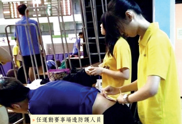
» 任運動賽事場邊防護人員