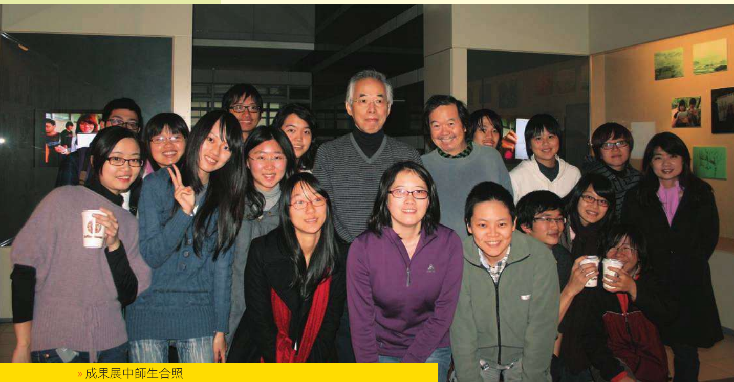
» 成果展中師生合照

在陽明的人文藝術學科中，從來沒有開設繪畫課程。雷驤老師生活隨筆的繪畫風格，也觸動了同學心靈深層的美感。從這次的學期成果展，可以看出學生對於線條已經從「一筆畫」開始，漸漸懂得觀察物體曲線的細微起伏，並利用濃淡粗細的呈現繪出光影明暗的變化。用不同的觀察角度，重新看待周遭的人物與風景。🌸