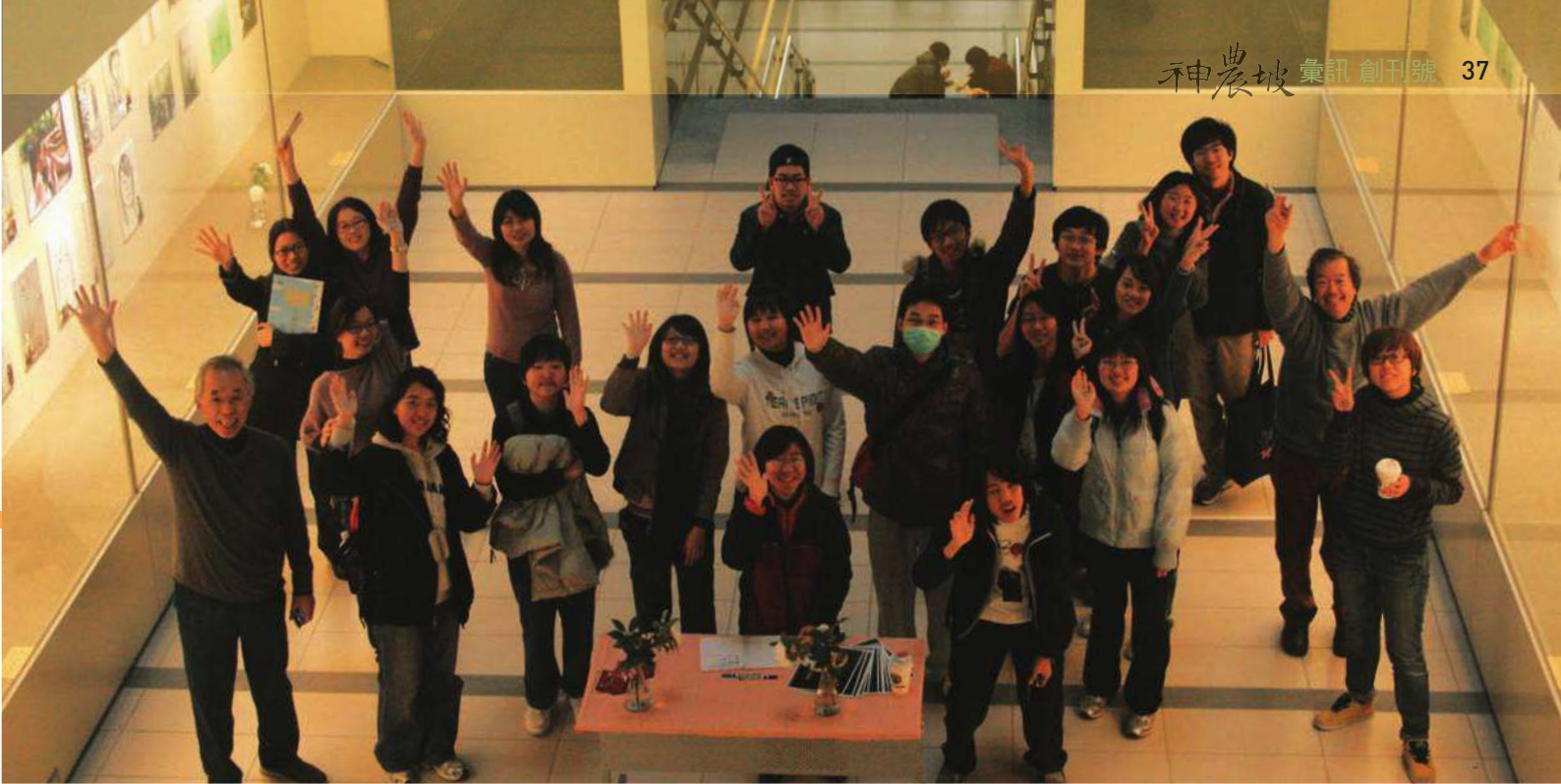
» 「梭～線條的可能性」展場

雷老師記得他給學生的第一次作業，題目是「用一筆畫出個東西」。其中有位牙醫系一年級的學生，很老實的、精確的畫了「一顆牙的輪廓」給他！雷老師感慨的說，他多麼期待可以和陽明的同學，分享身旁大千世界的萬事萬物，而不是老惦記著專業的那顆牙。因此他想藉著圖像、顏色、形象的觀察與訓練，來提升學生深層的審美觀，達到一種心靈上的平衡。