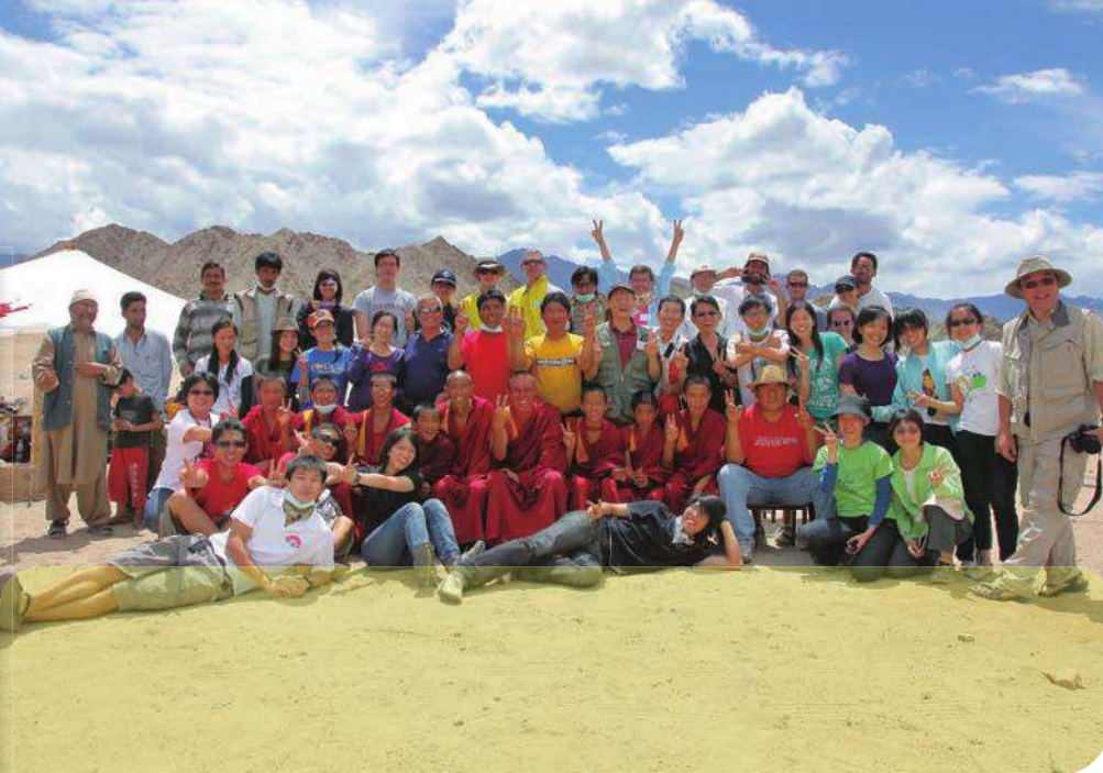
» 北印度拉達克陽明醫療團隊