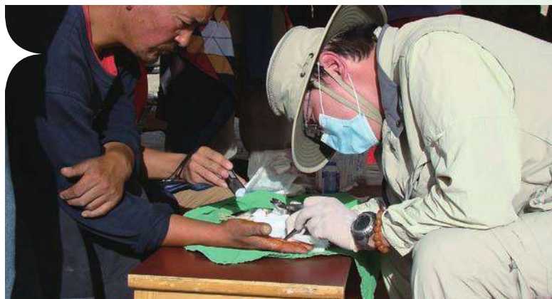
» 陽明志工團隊替災民義診

陽明醫療團隊表示，在北印度發生水災那段時間，看到很多國際的醫療組織及志工，不畏洪水肆虐趕赴救災，有人醫病、有人翻譯、有人協助災民整理家園。許多的捐贈物資及媒體紛紛湧入，將來自世界的關心送達災區，也將災區的苦難傳送到全球各地。這時大家愛心凝聚不分彼此，地球村家人之間的愛充滿了整個北印度災區，真正展現了大愛無國界的精神。●