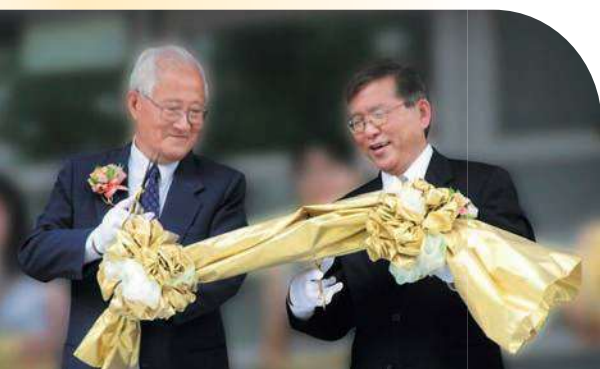
» 新圖書館落成，韓校長參加剪綵典禮