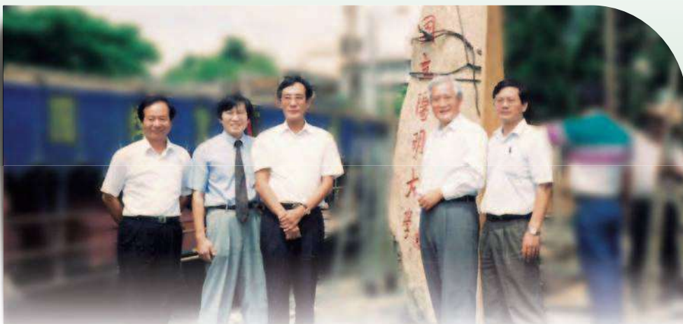
» 陽明改制大學揭牌儀式