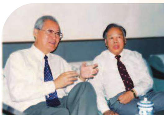
» 韓校長與北京醫科大學王德炳校長（右）