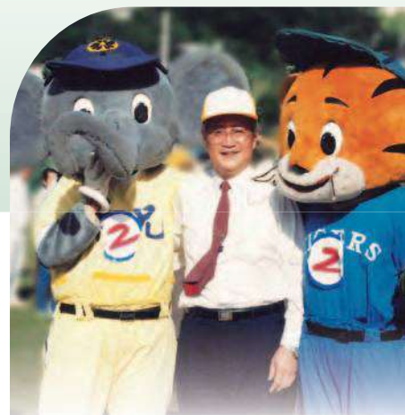
» 韓校長陪著本校棒球隊出賽