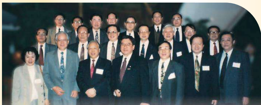
» 韓校長邀請大陸 14 位部委醫科大學校長訪問陽明