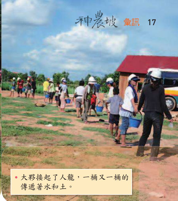
• 大夥接起了人龍，一桶又一桶的傳遞著水和土。