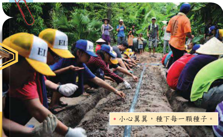
• 小心翼翼地，種下每一顆種子。