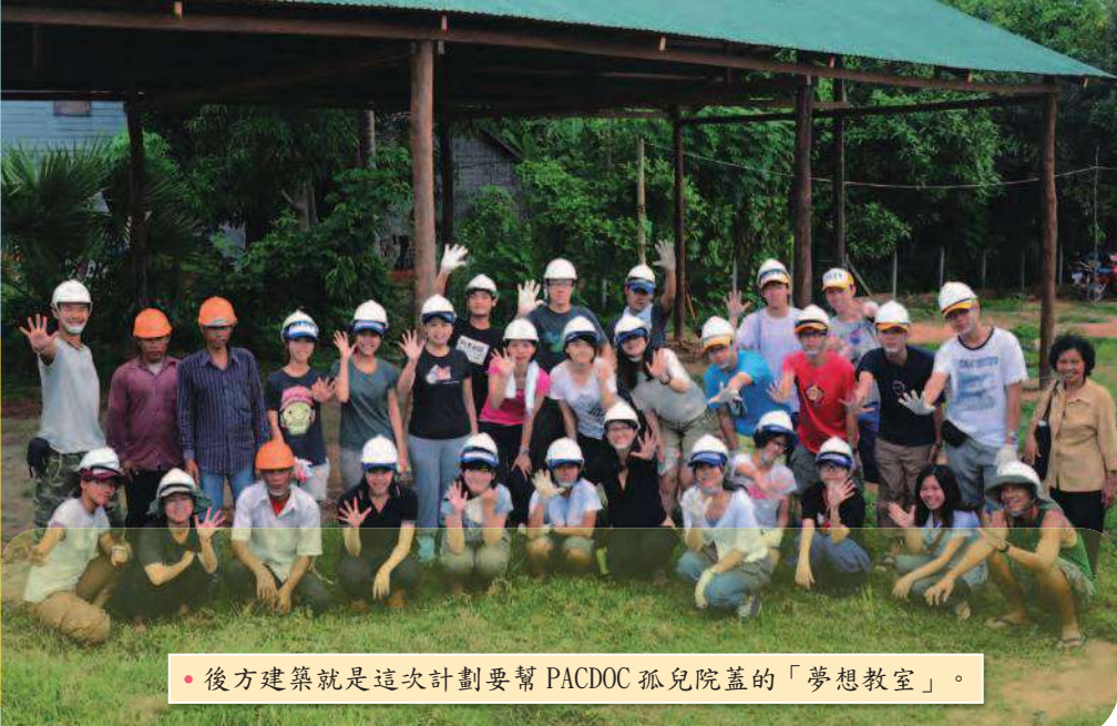
• 後方建築就是這次計劃要幫 PACDOC 孤兒院蓋的「夢想教室」。