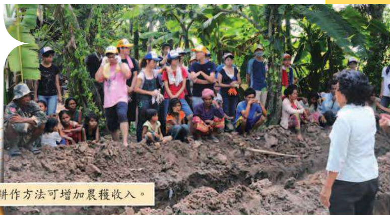
• 透過翻譯，告訴村民這樣的耕作方法可增加農穫收入。

第四、第五、第六天我們進入了 TAKAM 村落做農業推廣，這又是另外一個重訓的開始。在