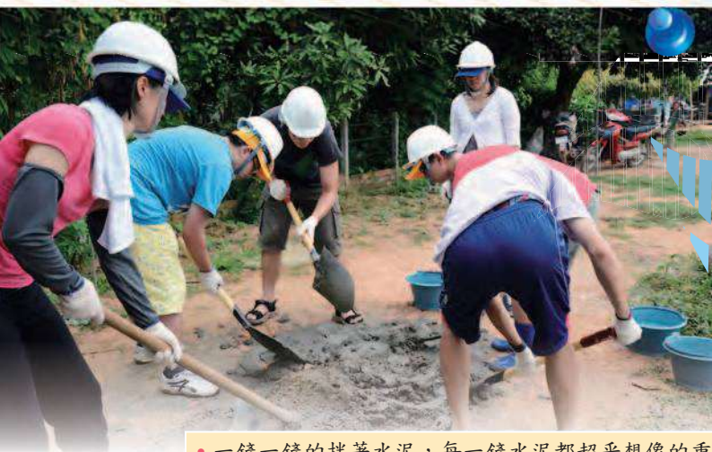
• 一鏟一鏟的拌著水泥，每一鏟水泥都超乎想像的重。

台北鋤頭大鏟子都是印象中的名詞，從未真正在手中操作，牛糞堆肥？這件事情在充滿城市思維的腦海中，也只是個名詞。而我們需要挖出四條很深的溝，需要用最天然的肥料—牛糞炒落葉。所以挖土、傳土、堆土、撿牛糞、撿落葉炒牛糞，就成為這三天不斷重覆的工作過程。