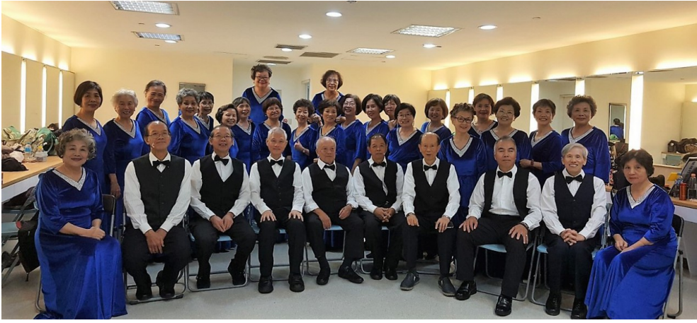
唱出興趣的愛鄰活力不老合唱團。