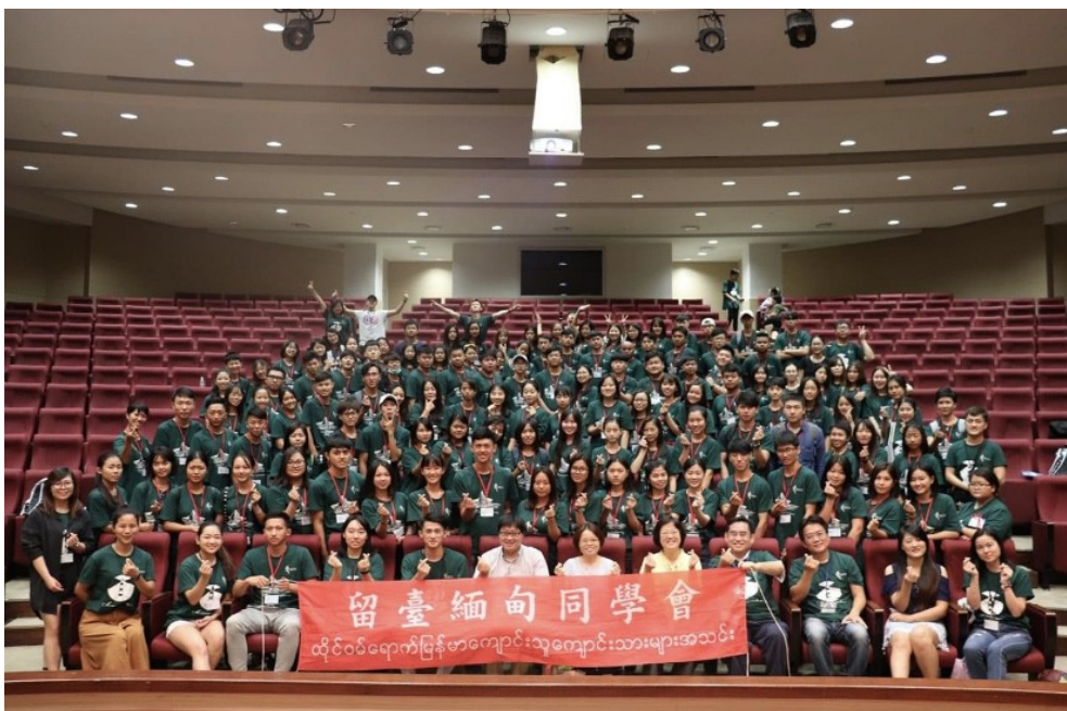
2018年度MOCSA (留台緬甸同學會) 接機迎新活動。

緬甸僑生來台留學，現今已成為普遍的現況。追溯回60、70年代，那時老一輩的緬僑會選擇來台打工；然而隨著時代的改變，為了工作而來的緬僑數量減少了許多，多數是以留學的方式來到台灣。如何克服來台的困境？到台灣就學後又會有什麼樣的機會和發展？此皆為許多緬僑正面臨的問題。