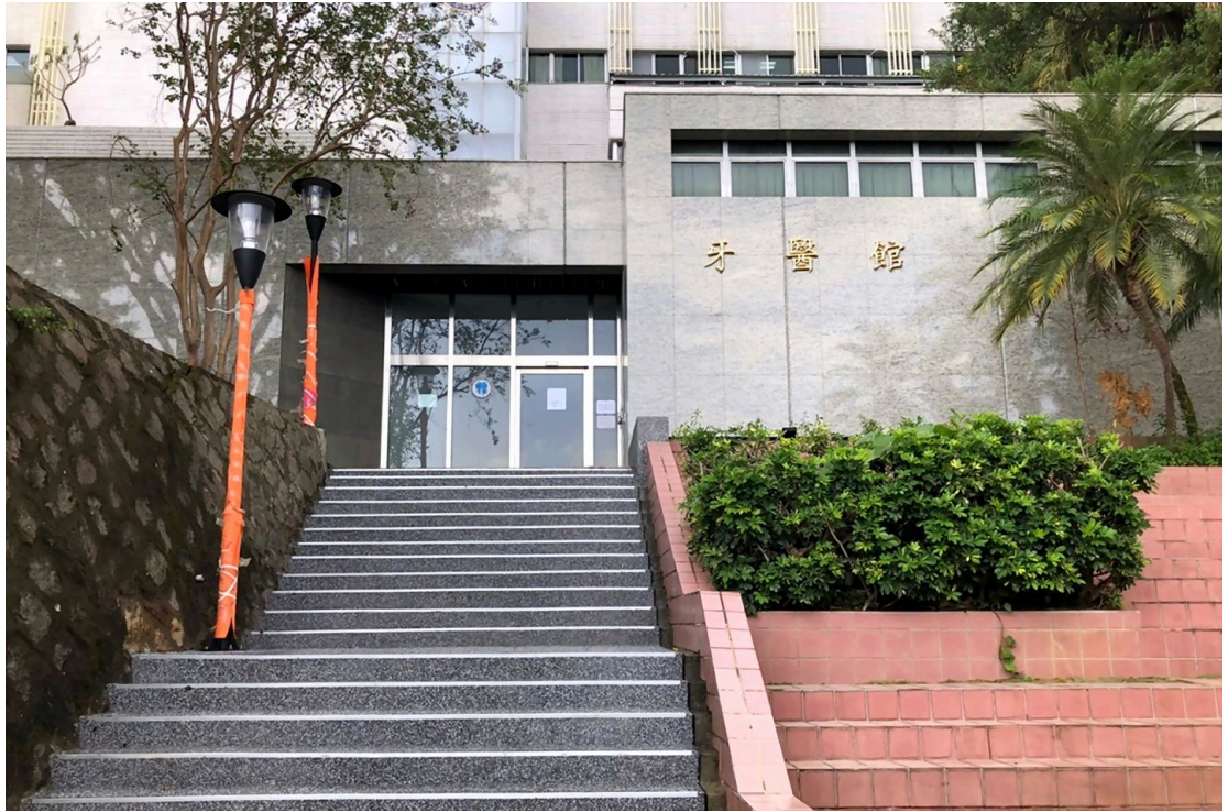
完成整修的牙醫館展現煥然一新的面貌

歷時近一年規劃、整修，牙醫館整修工程終於在今年11月竣工。牙醫學院於11月19日舉行啟用茶會，介紹大幅整修後嶄新的牙醫館與設施現代的教學環境。