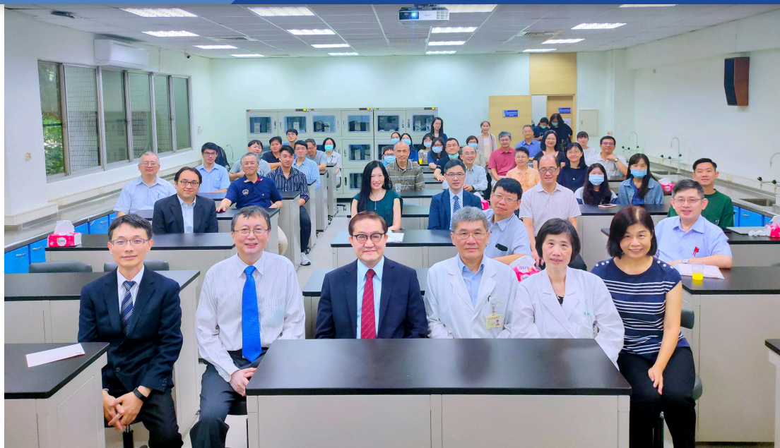
參與啟用茶會的師生，合影於整修完工之320實驗教室