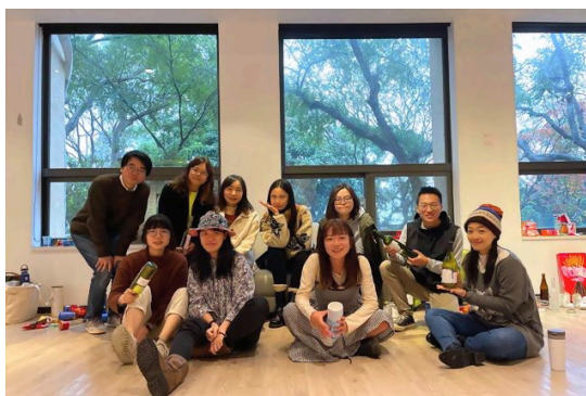
「身外之物聯展」創作者合照