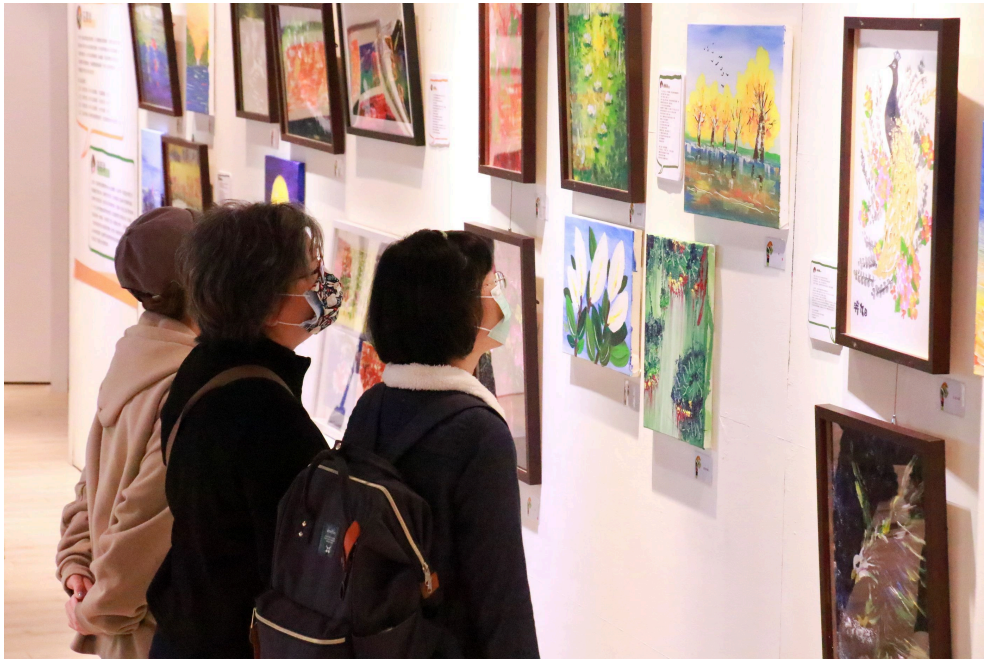
觀眾從畫家莊景旭的創作中走入他的慢飛異想世界