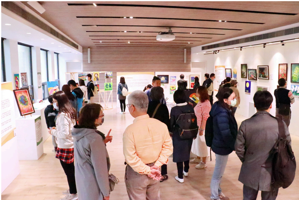
3月7日開幕當天「藝空間」展覽現場