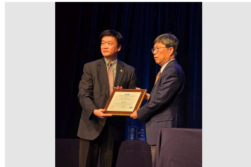
玉山學者郭育教授獲得2024 EDS J.J. Ebers 獎