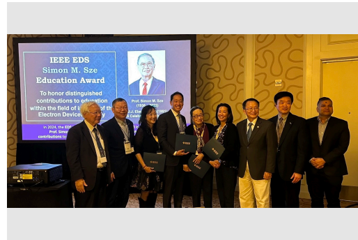
主辦方於晚宴邀請施敏院士家人，頒發以施敏教授命名的名的EDS教育獎「IEEE EDS Simon Min Sze Education Award」，以表彰其對半導體教育之貢獻。