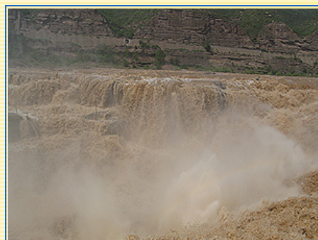
在壺口瀑布，可看到“天下黃河一壺收”

壺口瀑布西鄰陝西，東鄰山西，位於兩省的交界處，黃河流經這一帶地區，漸漸束窄，兩岸由於河床下切而呈峽谷，黃河洶湧澎湃，一瀉千里，當你到達壺口瀑布時，就可見到“天下黃河一壺收”鬼斧神工的傑作。壺口瀑布高度在15至20米之間並不算太高，但它的水量，卻是中國瀑布當中最的，