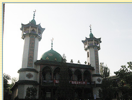
阿拉伯式建築風格的南關清真大寺，是寧夏規模最大的清真寺，可惜因背光攝影，無法呈現出它的壯觀景致

寧夏回族自治區於1958年成立，延續至今。現有回族兩百萬人，打從唐朝“絲綢之路”的商業大軍中，一部分來自西域的穆斯林愛上了寧夏，在此生根落戶，他們就是如今寧夏帶著小白帽的回族兄弟的先祖。同心縣是“回族之鄉”，有全國著名的南關清真大寺和濃郁的回族風情。這座始建於明末清初的寺廟，1981年重建，改為阿拉伯式建築風格，是寧夏規模最大，景致最壯觀的清真寺，寺內最大的建築是做禮拜的大殿，但非穆斯林是禁止入內參觀的。