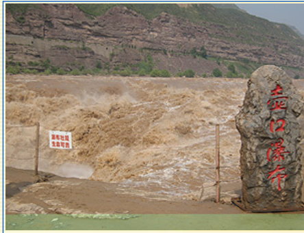
當地個體戶，私自設立了“壺口瀑布” 的招牌，向攝影的遊客收費

勢、那聲響，則是最雄壯奇觀了，數里之外，便可聽到壺口瀑布之轟隆聲響，瀑布激起之團團水煙雲霧，遠遠的即可看見。在陽光的照耀下，一道道絢麗的彩虹，橫跨蒼穹，剛中又帶柔氣。