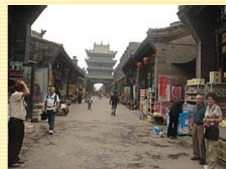
平遙古城內，明清時期的一條街店面

它建於西周，公元1370年擴建，歷經千年風霜而風采猶存，城市格局、風貌、規模基本未變。在2.25平方公里的古城內，至今仍居住著4.2萬人，城牆、街道、民居、廟宇等建築古風依舊，街道兩旁的店鋪多為17至19世紀的建築，是中國現存最完整且保持明、清時期歷史風貌的古代縣城。平遙古城有著獨特而豐富的文化遺存，包括了保存最完整的古城牆，中國現存最珍貴的木構建築之一，它還曾是19至20世紀初期整個中國銀行業的中心，中國金融業的開山鼻祖日升昌票號，就是從這裡走出山西、走向世界的。