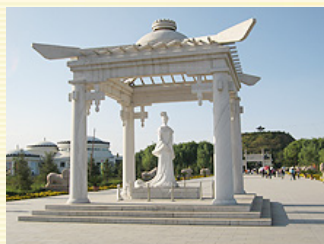
夜晚到來，打了燈光的平遙古城牆，顯得瑰麗壯觀