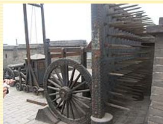
城牆上還留有古代維護安全的武器