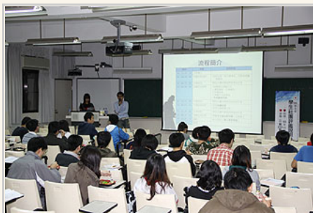
2010年10月辦理社評說明會

陽明課輔組的業務重點除了社團，尚有導師業務、獎助學金。而每個成員被分配到的任務雖有重疊，但大致來說是各司其職，術業有專攻。