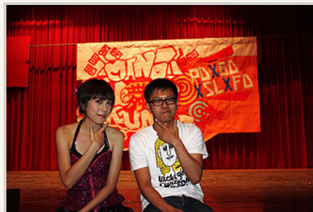
參與國標社成果發表會

在我到課輔組的一年，課輔組並無發生嚴重的案例。不過有個小事件，今年的暑假得到一個訊息，我所輔導的社團社長因成績三分之二不合格被退學了。這個社長比其他社團社長更常跑課輔組，和他算熟悉，因而難免有些捨。學期間，從他同學口中知道他不太去上課，我見到他時，問他是否是因為社團影響課業，他的回答不上課跟社團無關。後來，發生了如此不幸的事件，讓我震撼了一下，這或許是我無法改變的，我也有關心過他的課業，但還是發生了。