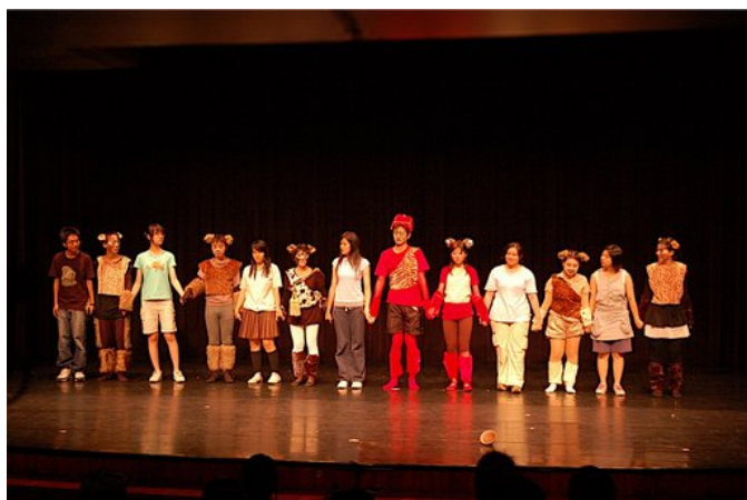
手牽著手，夥伴們的羈絆讓人覺得窩心。

不管是哪一次的演出，大家一起為了一齣劇努力的團結精神，才是我喜歡演戲的最主要原因！大家一起哀嚎劇本超難背、一起同台飆戲大罵對方、一起排完戲後聊天吃宵夜、一起嘻嘻哈哈讓氣氛變的超歡樂，這些準備過程的心酸血淚才是一輩子都難以忘懷的美好。觀眾掌聲拍得再久也敵不過這些回憶，排戲再辛苦都是種甜蜜的負荷，大家互相打氣關心，夥伴們之間的羈絆，讓人想到都會覺得心暖暖的。