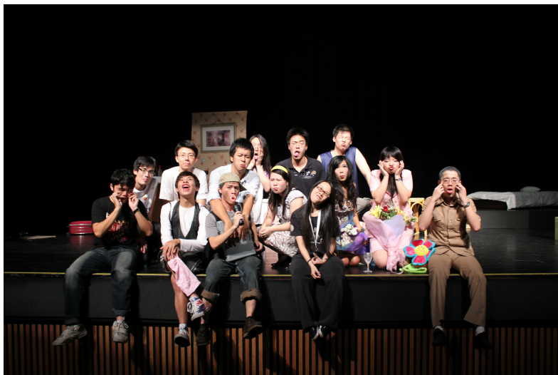
你會用什麼表情去面對你的如戲人生呢？

一定要細細品味自己的人生，用各種不同的角度，「人生」這齣戲的劇本是由你自己寫，劇本的每個字句，都該好好品嚐，好好享受這個舞台吧！