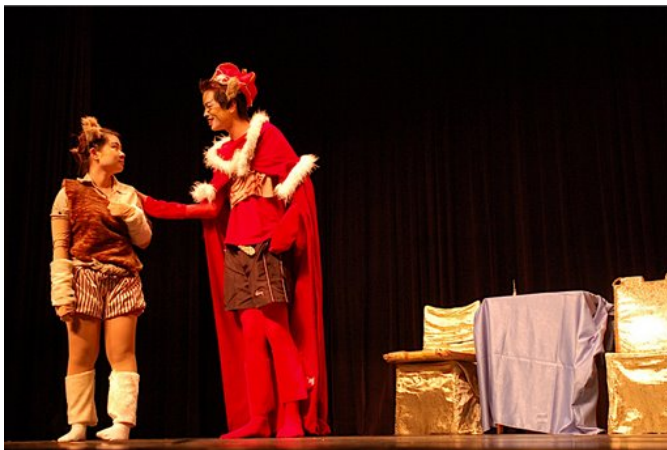
和其他演員對戲的交流細膩度不是一件容易掌握的事情，除了動作還得藉著眼神演出王子和父王之間的親情之愛。

每週搭車從基隆到台北，這一路上看著車外，行人來來往往，浮現在腦海中的不是台詞，而是一連串的疑問句：「好可怕，搞砸整齣劇怎麼辦？一切的努力值得嗎？」太多的不確定和沒自信，總是讓自己陷入低潮。但是導演和夥伴們總是會互相鼓勵，大家一起想辦法，給了我自信，但卻也讓我更害怕！我想回應大家的鼓勵，同時，更怕自己無法突破，有個幽暗的想法一直在我心中揮之不去：「一切都只是在浪費大家的時間，這一切是否值得呢？」最後，淡水演藝廳的幕降下，觀眾如雷的掌聲，我得到答案：「值得」。