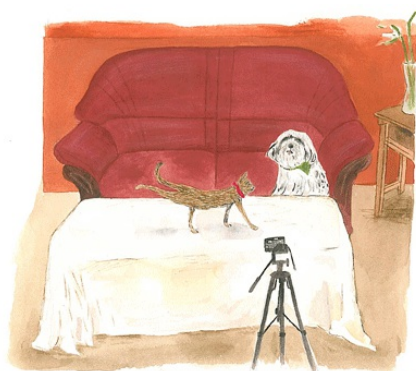
你們狗狗都不懂

一開始，書中就出現很多關於動物的畫作，以及用簡單線條畫的剉冰插畫，顯示李瑾倫對動物的觀察入微。她用插畫描寫了貓咪的特性，讓讀者可以更容易想像貓咪的觀點，再配合文字描述，即使是沒養過寵物的人，也可以進入寵物的世界，了解牠們在想什麼。