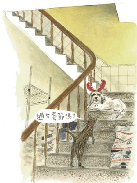
貓貓狗狗的童趣對話