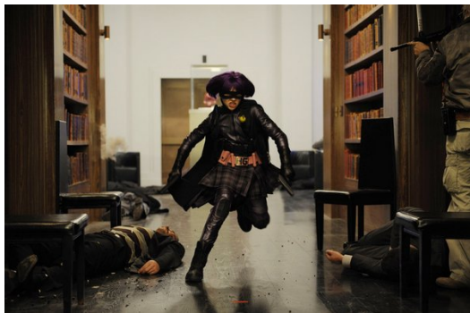
Chloe Moretz在驚悚片之後挑戰動作片，表現可圈可點。

在貫徹他堅信的正義時，其他人在做什麼？他們什麼也沒做，就只是圍觀、拍攝，甚至連戴夫要他們報警時，也只是笑著繼續拍。