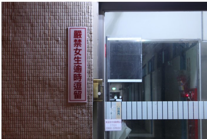
各大男宿前，都貼了嚴禁女生逾時逗留的牌子。（攝影/李宜融）