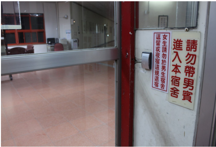
交大女二舍門口這學期初多了一個告示牌，提醒女生勿在違規時間逗留男宿。