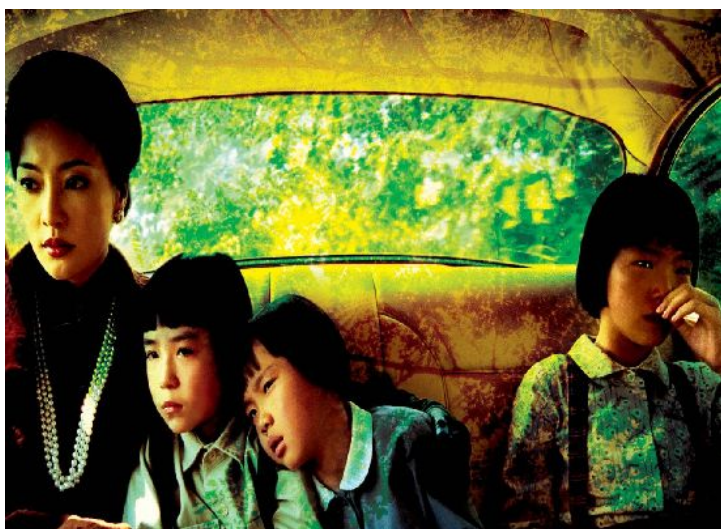
色彩斑斕，《淚王子》用心於畫面的呈現。

畫面靜止幾秒後暗下，呈現人物的寂寞感。這些精緻的畫面，通常出現在重要的劇情之後，漂亮的風景搭配音樂旋律，留給觀眾大片留白思考的空間。