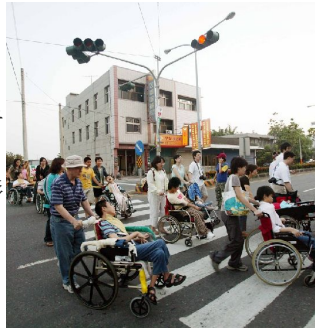
網友們推著聖心教養院院有過馬路的情形。

整個「紙風車319鄉村兒童藝術工程」除了發起人與捐款者外，也吸引了許多人一路跟隨，像是民謠歌手陳明章夫婦，陳老師除了在每一場演出前都先負責暖場的任務外，更把現場銷售專輯的30%全捐給了活動，如此地鼎力相助是因為認同與妻子的支持，讓這位國寶級的民謠歌手願意一場場免費的唱下去，不收一分一毫。「紙風車319鄉村兒童藝術工程」的活動攝影師張大魯，除了擔綱攝影師外，對於募款活動也是不遺餘力地支持，其中在嘉義縣東石鄉的演出就是由他所一手促成，這場演出與眾不同的是，他還特別邀請了聖心教養院的院生們一起前來觀賞，雖然最初在募款時遭遇許多困難，但最後靠著眾多網友的拔刀相助，終於衝破三十五萬的大關，在演出完成後，張大魯與來幫忙的網友們相視而淚，但為了這些院生們的笑容，一切都是值得的。