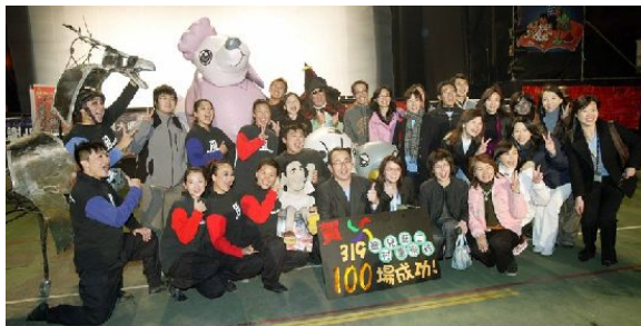
319鄉鎮巡迴第一百場成功照。

截至今日，紙風車劇團已完成230個鄉鎮，268場的演出，距離目標也僅剩89個鄉鎮，具體觀賞人次也突破五十六萬人，捐款人次也達到兩萬人，相對目前政治社會上的角力，在藝術創作上更可以看見台灣民眾的齊心協力；孩子們的笑容是最純真的，在孩子們的笑容中看不到政黨顏色，也看不見城鄉差距，「紙風車319鄉村兒童藝術工程」是為了給孩子笑容，一步一腳印將生活藝術的創意與快樂，散播在每位小孩身上，也讓平常難以接觸藝術的小孩子們，擁有親近藝術的童年回憶。