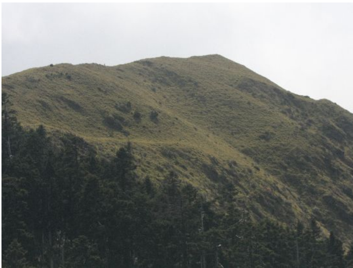
從合歡西峰回望來時路。合歡西峰步道是少數回程上升多於下降的百岳，因此攀登起來格外有難度。

位於南投縣與花蓮縣交界處的合歡山森林遊樂區，素有「雪鄉」之稱，是國內的熱門旅遊景點。由於地形與氣候條件特殊，造就了當地獨特的自然景觀。再加上交通易達性高，因此往往成為假期中旅客出遊的選擇對象。