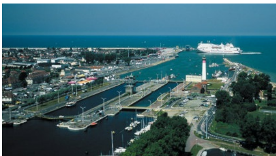
烏斯特罕碼頭被稱作是最可怕的工作環境，也是作者擔任清潔女工的地方。

而書中也不乏出現許多圍繞在作者周圍的勞工，無論是就業中心裡、輔導課程中，或是實際工作的同事，都是整體就業體制下的犧牲者。但是作者對於每個小人物的故事刻劃，並沒有多加著墨，只是平淡地交代大致背景，而沒有賦予他們說話的權利，實為可惜。尤其作者接觸的多為女性勞工，在資本主義結構下的工作環境裡，女性勞動者往往必須面對階級與性別的雙重歧視，若是能在这部份加以描述，這本書會更具張力，也更能反映出勞工階層的根本問題。