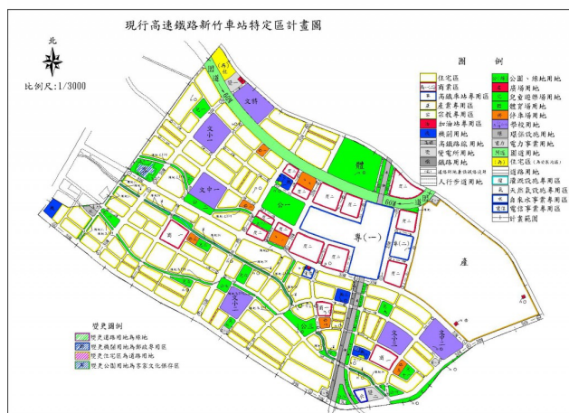
現行高鐵特定區都市計畫圖。

新竹縣竹北市在高鐵特定區帶動之下蓬勃發展，但是在都市化的快速發展中，出現了對於客家傳統文化的保留與否問題，公三公園現今正面臨這樣的問題。