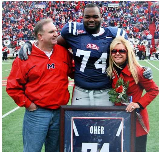
在珊卓布拉克獲獎的同年，真實世界的麥克歐爾也在球場上替球隊獲得了冠軍。

由珊卓布拉克所飾演的杜希，劇情設定下是一名中產階級下的婦女，詮釋一位在家是盡責媽媽，在外是能力極強的女性代表，以往在電影中扮演著動作類型的強悍性格的珊卓布拉克，在此片中充分展現她能硬能柔的演技，也讓她因《攻其不備》在奧斯卡得到最佳女主角的殊榮。而飾演麥可的昆東艾倫，雖然台詞不多，卻需要表現極度內向，並運用大量肢體和表情動作來詮釋這名角色，實屬不易，若演不好就會像是自閉症一樣，但昆東在這方面表現算是非常稱職。