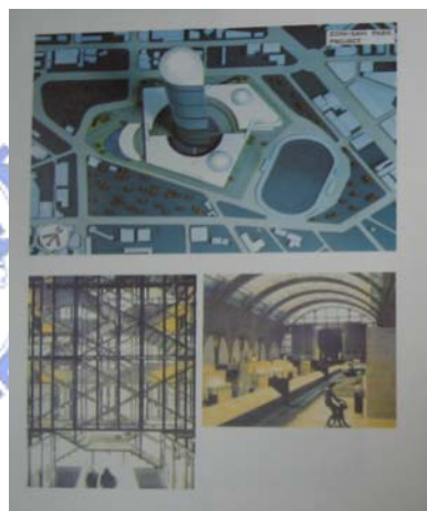
圖 2-4 文化科學城高塔市標之構造圖

不過，在地方政府仍醉心於新竹科學城願景描繪的同時，新竹地區市民社會也隨著 1990 年代初期台灣民間力量的興起而逐漸萌芽，市民意識亦隨之抬頭。1991 年 8 月創刊的《新竹風》雜誌，係新竹地區首度集結地方知識份子的地方性刊物，以李遠哲為榮譽發行人，清大教授黃提源為社長、傅大為教授為總編輯，發起人 60 餘人包括大學教授、律師、醫生、企業家、工程師、記者、家庭主婦等，內容涵蓋教育、文化、生活、環境、公共政策、法律等面向，主要目的在於「喚起新竹人的鄉土之愛，增進人群 / 族群的溝通了解，提昇新竹地區的人文素養和文化自主性，並且對地方公共政策善盡監督之責」（《新竹風》創刊辭）。該刊內容強調市民自主意識，並思索文化科學城論述的地方發展與文化定位，例如質疑新竹市文化中心的基本宗旨和功能，建議文化中心「思考新竹特有的人文風