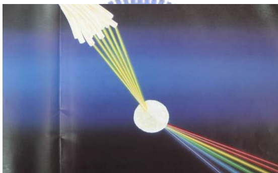
圖 2-2 1990 年新竹科技展海報

有趣的是，地方政府視高科技為象徵進步的文化定義之一，意圖取代地方傳統（落後）特色。在1990年，新竹科技展的宣傳海報（圖2-2）更直接顯示地方首長期望高科技（光纖、半導體）的進步象徵，取代傳統的米粉、貢丸，而成為新竹市的嶄新的地方特色 28 。1990年7月，由市府、科學園區、工研院、食品研究所和地方社團 29 所合辦的新竹科技展，主題為「人、科技、社會」，即在強調：人類發展高科技之目的在於改善生活，而非與社會脫節。本著「易懂、易瞭解、易體認」之原則，一來希望提升新竹民眾的科技水準，促進文化科學城的建立 30 ；二來則是藉此展覽教育民眾認識科技，化解因隔閡、「無知」而產生的排斥與抗爭心理 31 。