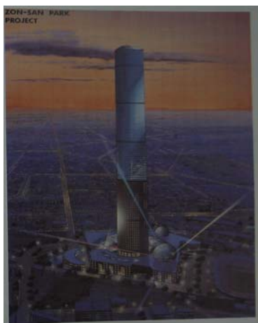
圖 2-3 文化科學城高塔市標之構想圖

的確，新竹市沒有一個特徵，以前曾喊出的貢丸、米粉是新竹市的特徵，但我不認同；一個文化科學城，它的特徵應該是文化科學，以文化科學取代原來的貢丸米粉。在硬體上的特徵現在看不出來，除了一個東門城還可以算是新竹市特徵外，其它都看不出來……最近我想幾個規劃，希望現在的文化的中心，讓它真正變成文化中心的一個 leader mark，在體育場這邊也是有一個路標，還想找一個公園，由私人企業建一個二、三十層樓的高塔，塔上有一個旋轉式的，上面的頂蓋，飛機飛過去就可以看到文化科學城…（1990 年 5 月新竹市議會第三屆第五次大會，《新竹市議會議事錄》，1990：389）